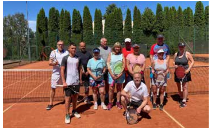
Tenisové odpoledne s turnajem dvojic se konalo v sobotu 6. července.