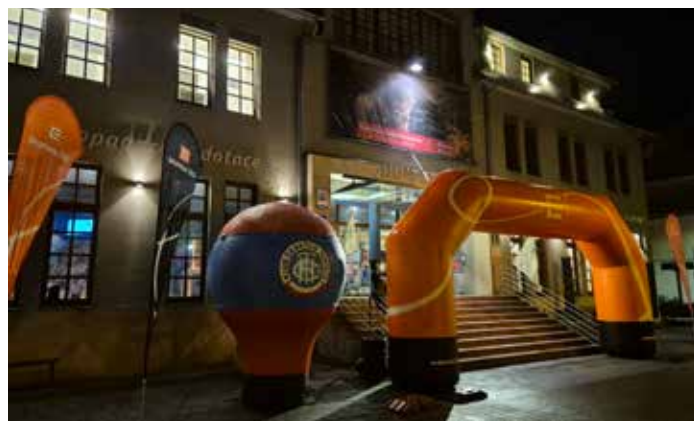
Základnou se skvělým zázemím se pro celou akci stal Dům Českého Švýcarska. Turisté do něj proudili do pozdního večera.