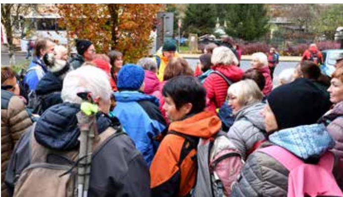
Celým městem po čtyři dny proudily stovky turistů z celé republiky, Slovenska, Německa i Polska.