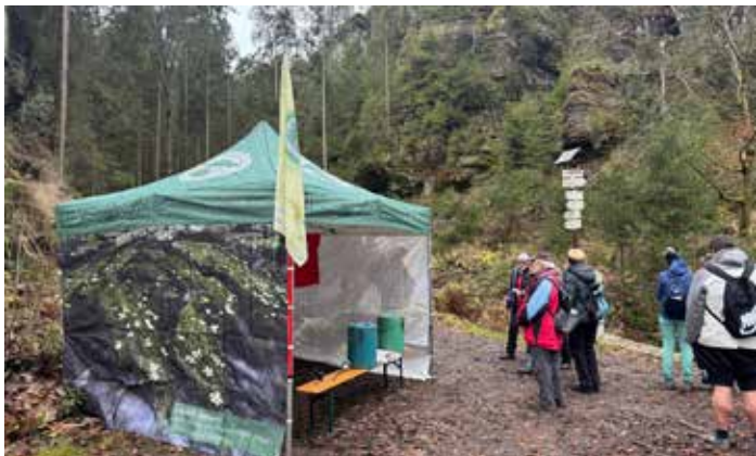
Jeden autobusový spoj vyrazil i na komentované prohlídky se strážci NP na spálenišťe a okolí Mezné.