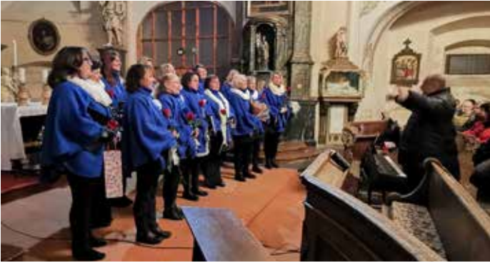
V sobotu v podvečer vystoupil v kostele nad náměstím Krásnolipský komorní sbor.