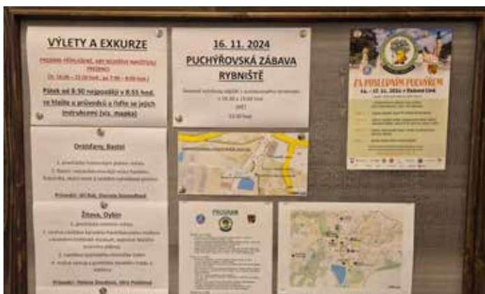
Kromě turistiky byla pro účastníky připravena i doplňková kulturní nabídka.