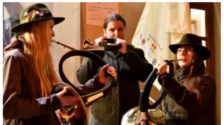
Fanfáry šluknovských trubačů zazněly na úvod oficiálního slavnostního zahájení Pochodu za posledním puchýřem.