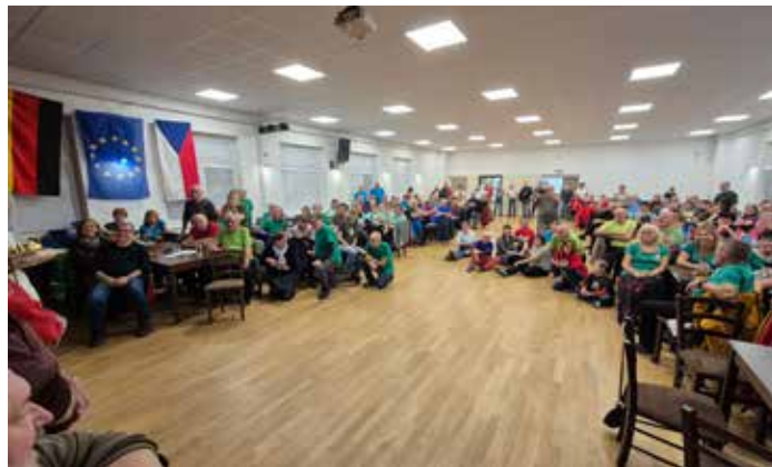
Protože o závěrečnou zábavu byl obrovský zájem, zaplnili jsme i kulturní dům v sousedním Rybníšti.