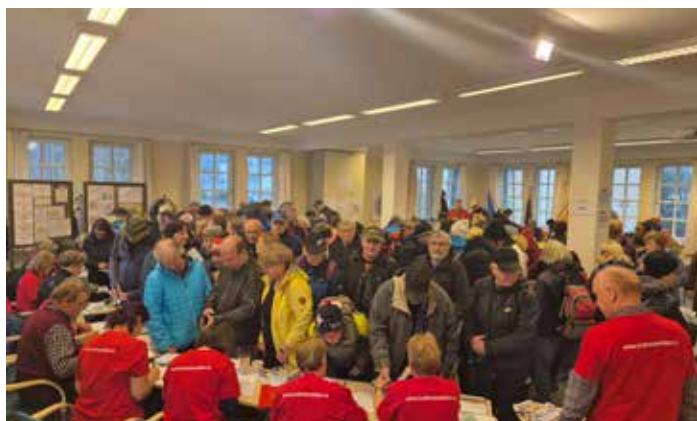
Registrace stovek účastníků by se neobešla bez pomoci mnoha dobrovolníků, V pátek i v sobotu občas Dům ČS doslova praskal ve švech.