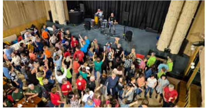
Závěr akce patří tradičně Puchýřovské zábavě. Taneční parket našeho kulturního domu byl plný spokojených tanečníků.