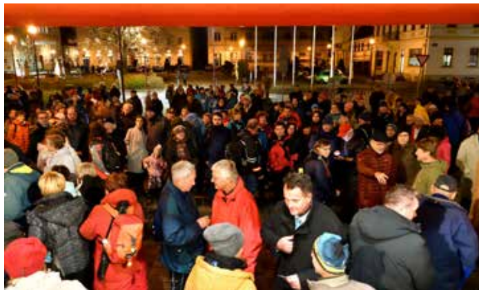
Náměstí před DČŠ, kde proběhlo slavnostní zahájení se v očekávání zaplnilo.