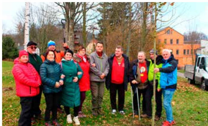
Jako trvalá připomínka akce byla zasazena spolu se slovenskými turisty KST Horňan Práznovce lipa stříbřitá.