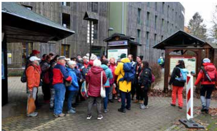
Sobotní ráno aneb turista kam se podíváš!