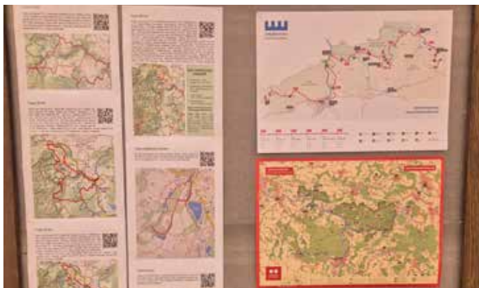
Turisté si mohli vybírat, z celkem 6 tras, ta nejdelší měřila 50 km.