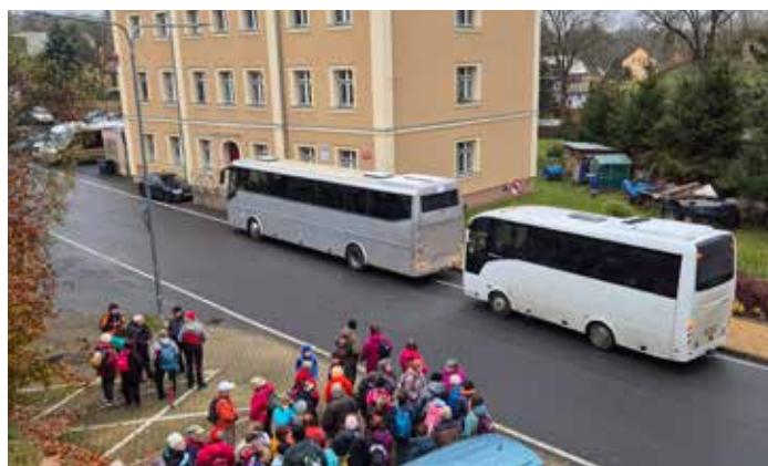
Pro předem registrované účastníky byly na páteční den připraveny autobusové zájezdy. Do Dražďan se vydalo 120 turistů, po dvou autobusech se vypravilo na Žitavsko a Šluknovsko.