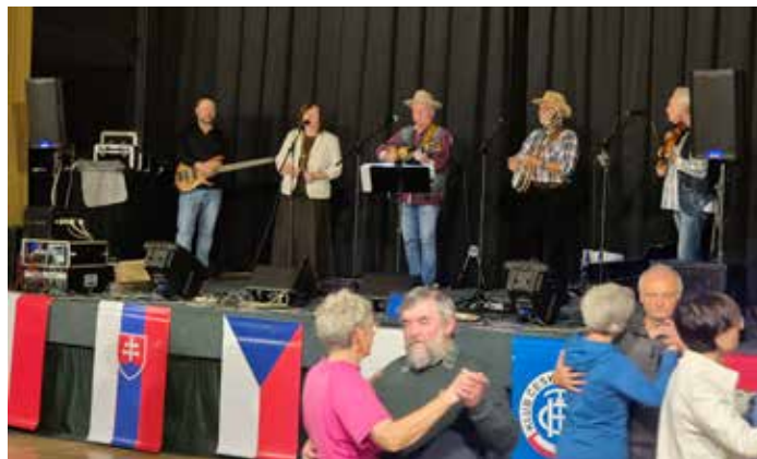
Páteční večer patřil country zábavě, která byla alternativou ke koncertu vážné hudby v kostele nad náměstím.