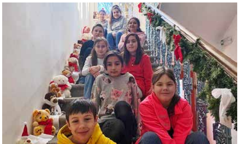
Vánoční tvoření čtvrtého ročníku ve Schrödingerově institutu v bývalém klášteře v Jiříkově

Jejich dojmy si můžete přečíst v následujících článcích.