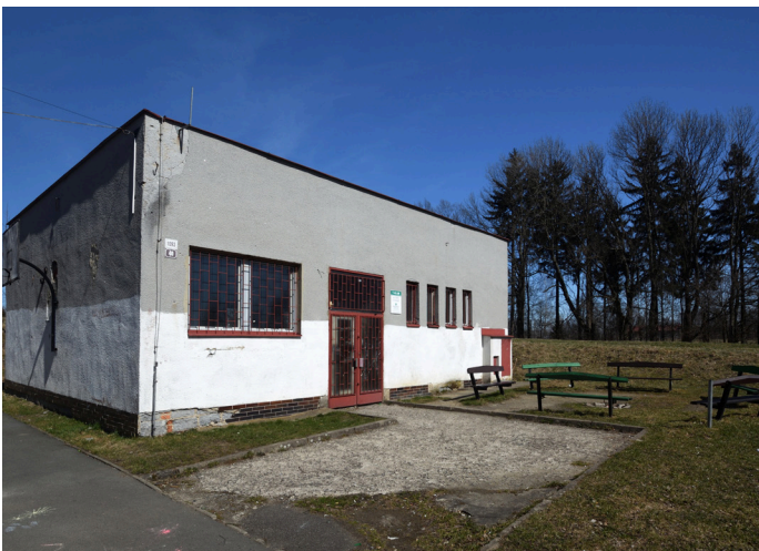
T-klub před rekonstrukcí a nyní