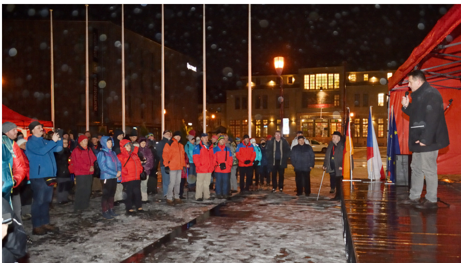
Fotografie ze zahájení srazu na Křinickém náměstí

V roce 2018 byl náš klub osloven ústředím KČT v Praze prostřednictvím její lyžařské sekce s návrhem, abychom se ujali organizace XVII. Mezinárodního zimního srazu turistů ČR. Následovala diskuze a schválení ve výboru odboru. Akce byla schválena i oblastním výborem Ústecké oblasti a 2. února 2019 na výroční schůzi OKČT Krásná Lípa. Všem jednatelům předcházela jednoznačná podpora našeho města.