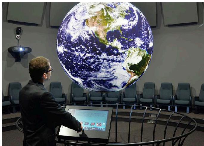
V nové učebně by měla být umístěna špičková technologie – Věda na kouli (ilustrační foto)