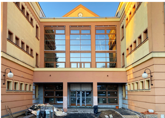
Přístavba budovy základní školy