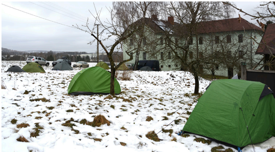
Součástí programu srazu bylo i tradiční Nejsevernější zimní táboření v Čechách v areálu terénní základny ČSOP Tilia v Krásné Buku