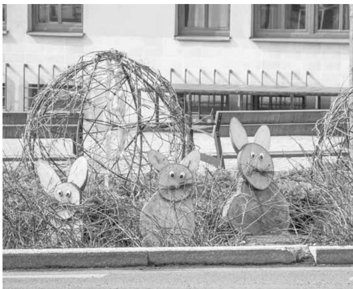
Velikonoční výzdoba na Křínickém náměstí a v budově radnice.