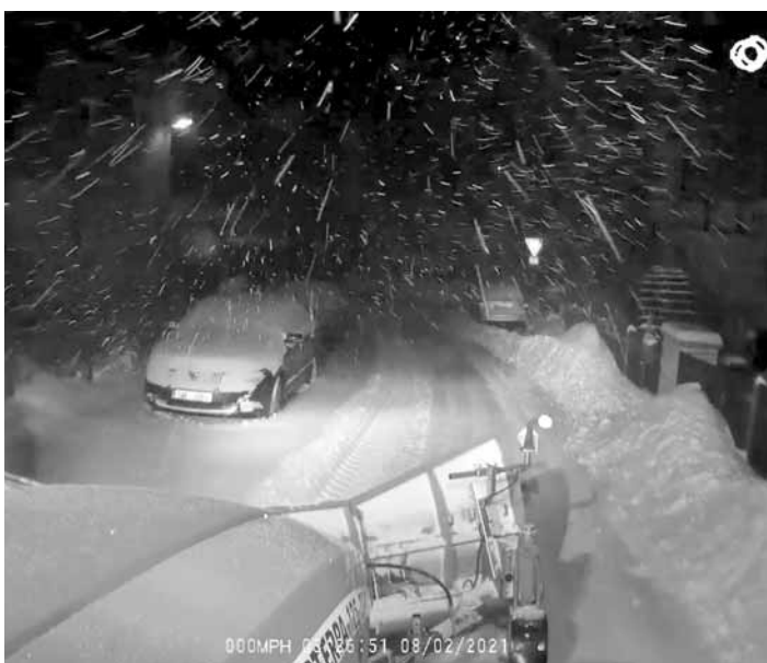
10 minut letošní zimy z pohledu a s komentářem pracovníka technických služeb. Možná budou mnozí překvapeni, jak to vypadá z kabiny zdánlivě neohroženého traktoru. Video, natočené během zimní údržby v Krásné Lípě 8. února 2021 po třetí hodině ranní, najdete na webu města www.krasnalipa.cz ve videogalerii (v menu Život) nebo na facebooku @krasnalipa.3