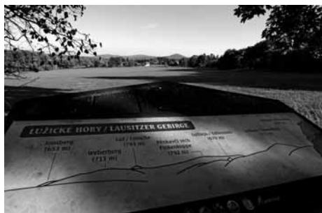
Lužické hory z Vyhličky u Kamenné Horky

Stavba rozhledny byla původně součástí českoněmeckého projektu, kterého byla součástí i Krásná Lípa s rozhlednou na Vápenném (Maškově) vrchu. Projekt však nakonec nebyl podpořen. V současné době máme připravený projekt, stavební povolení i pozemek a se stavbou rozhledny na Vápenném vrchu čekáme na rozumné dotační financování.