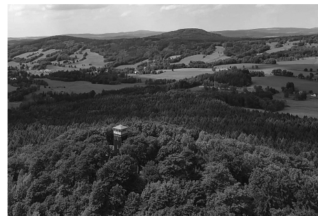
Do okolí Krásné Lípy Vás zase zavedou videotypy na výlet, kde rovněž najdete celou řadu zajímavých pohledů. Na fotografii jeden z nich – netradiční pohled na rozhlednu na Vlčí hoře.

Všechna videa najdete v naší videogalerii na stránkách www.krasnalipa.cz v menu život.