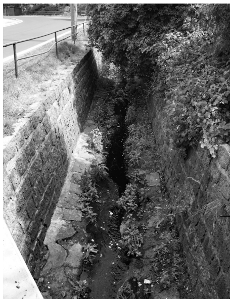
Nízká výška hladiny Křinice u Varnsdorfské ulice, na fotografii z neděle 22. 7. 2018. Aktuální výšku hladiny Křinice najdete na portálu www.povodnovyportal.cz . Odkaz najdete i na našich stránkách www.krasnalipa.cz v menu město / povodňový plán.