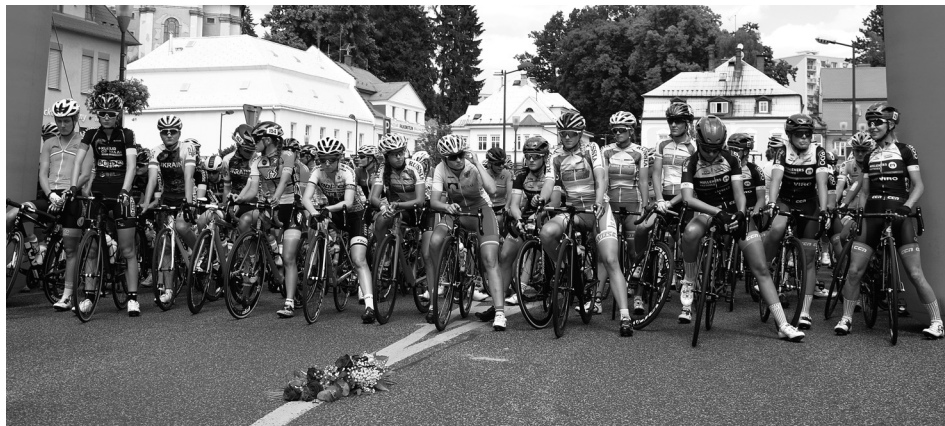
Krátce před startem 1. etapy i celého závodu 5. července na náměstí v Krásné Lípě.