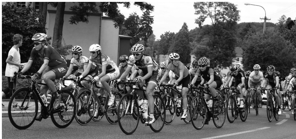
Jeden z mnoha průjezdů pelotonu Krásnou Lípou, tenhle je z poslední páté etapy, která se jela v neděli 8. července a cíl měla na Křínickém náměstí.