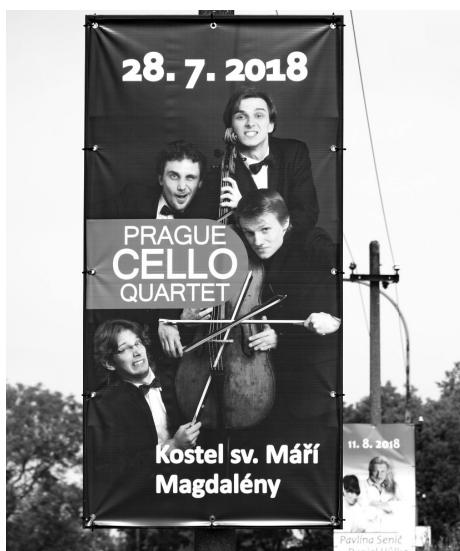
Na koncerty Kránsolipského kulturního léta Lásky i poutače instalované v Pražské ulici.