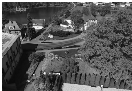
Ve videu Krásná Lípa z ptačí perspektivy najdete celou řadu úchvatných záběrů, především z centra města a nejbližšího okolí. Na fotografii pohled od sportovního areálu směrem k rybníku Cimrák.

Na toto video volně navazují další – videotypy na výlet , které Vás provedou celou řadu oblíbených míst nejen v Krásné Lípě, ale zejména v okolí. Celkem