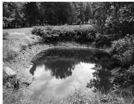
Sucho je vidět i na první pohled, jako třeba na těchto fotografiích z 22. 7. 2018 z městského parku.