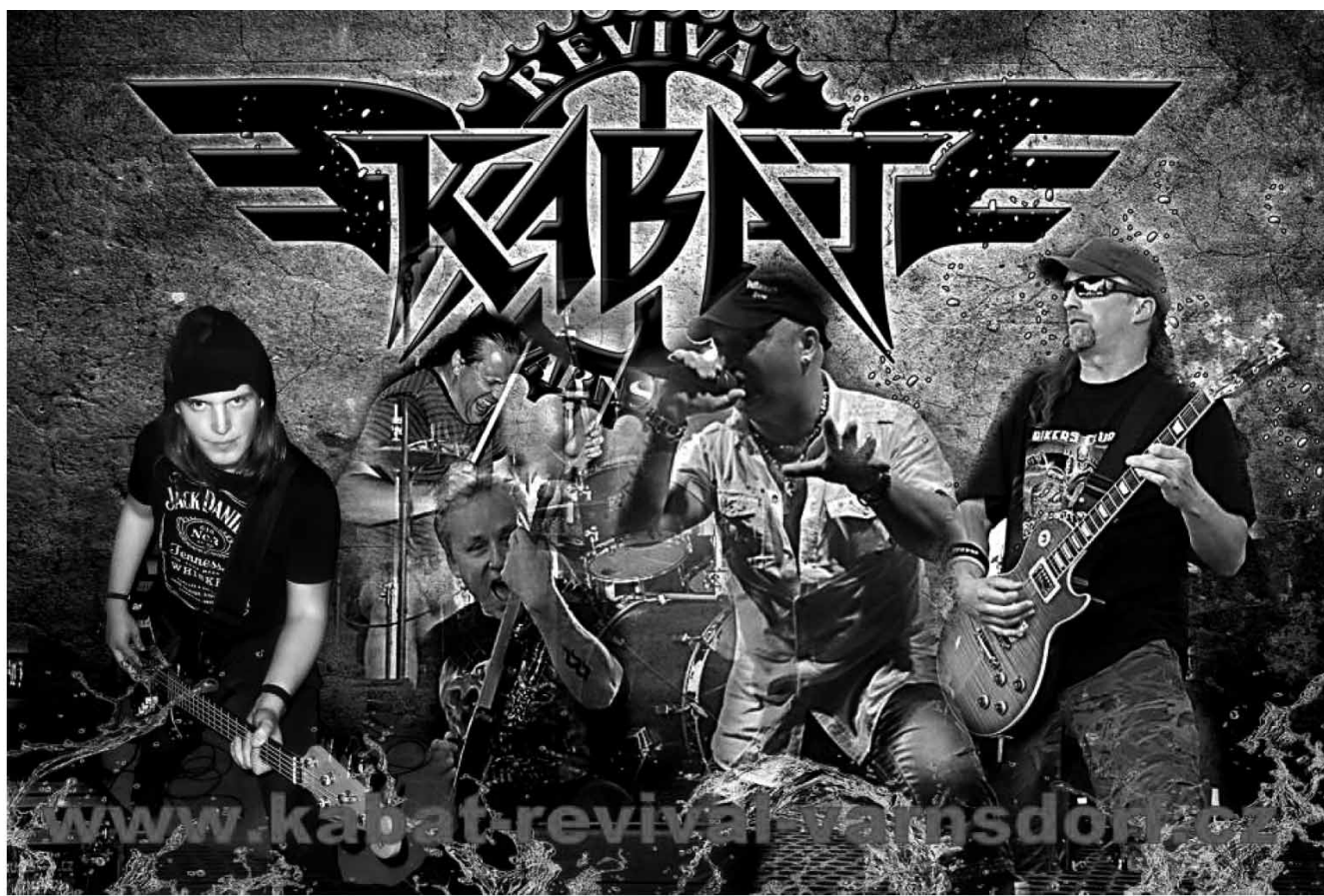
Změna programu vyhrazena / Na akci jsou pořizována foto a videa. Ty mohou být použity, zveřejněny či poskytnuty pro účely propagace města Krásná Lípa