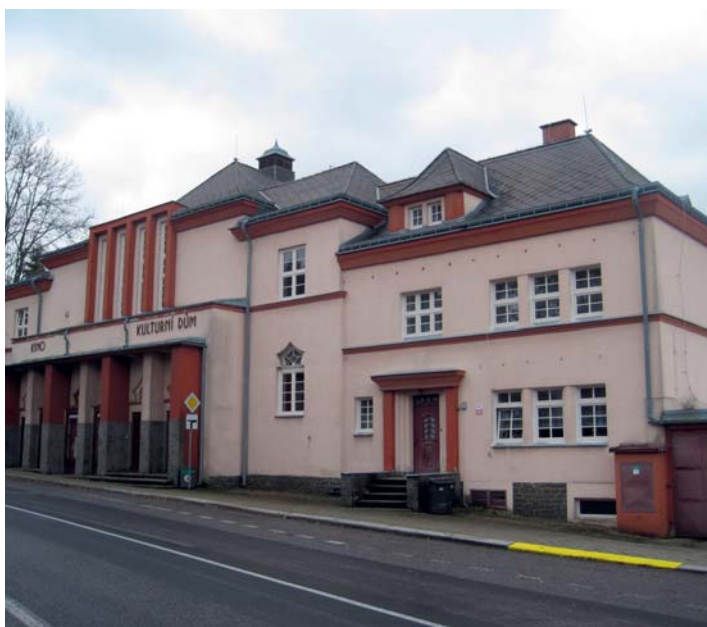
Výměna oken v kulturním domě