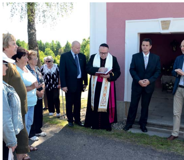
Žehnání obnoveným sakrálním památkám