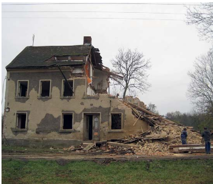
Demolice objektu El. Krásnohorské 19