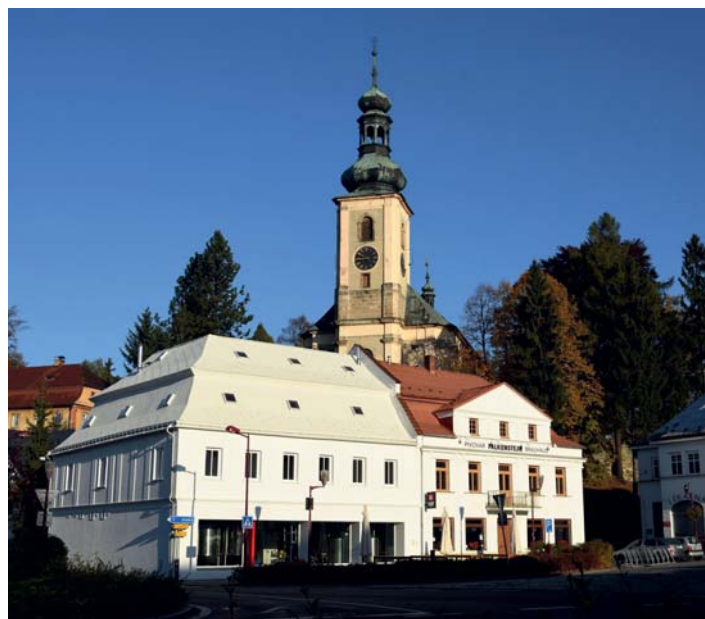
Pivovar Falkenštejn se rozšířil do sousedního objektu