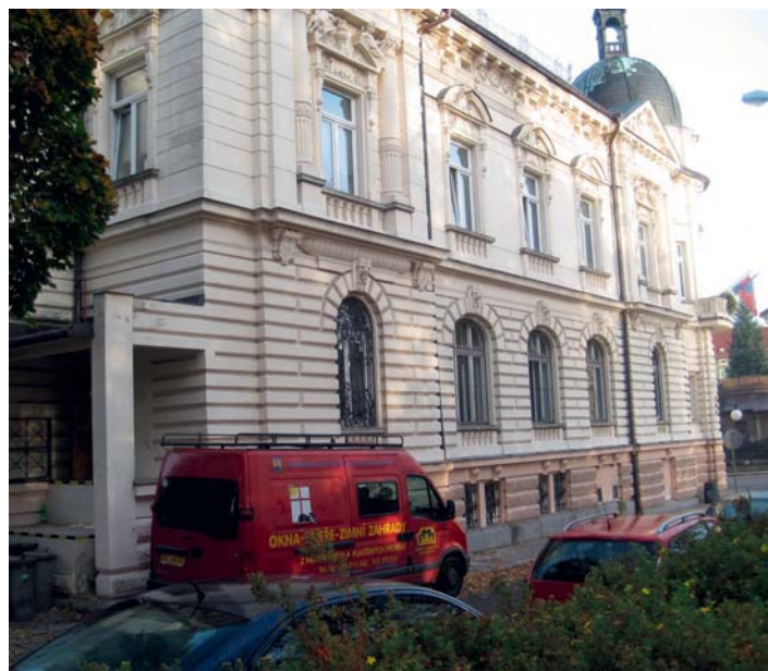
Výměn oken na poště