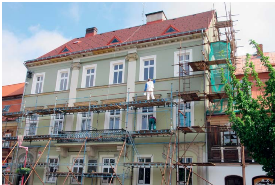
Oprava fasády Křínické náměstí