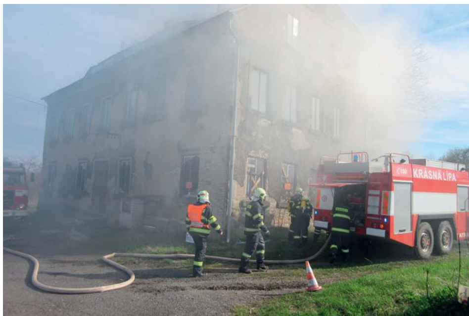
Aktivní hasiči uspořádali námětové cvičení s kolegy z Rybníště