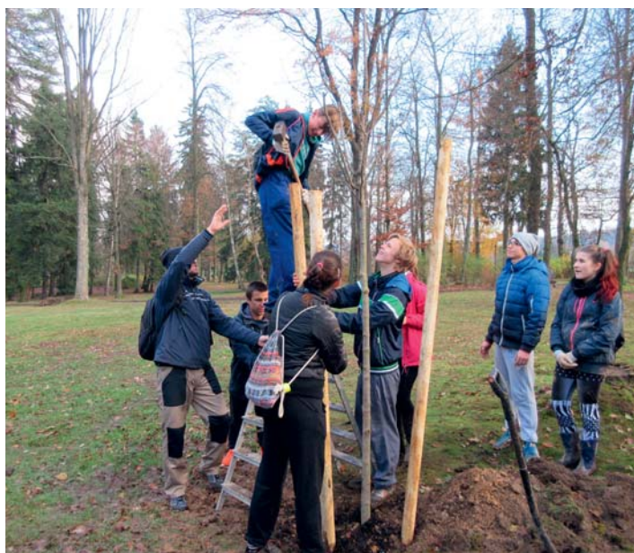
Výsadba v Městském parku