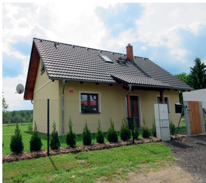
S podporou města se staví nové domy