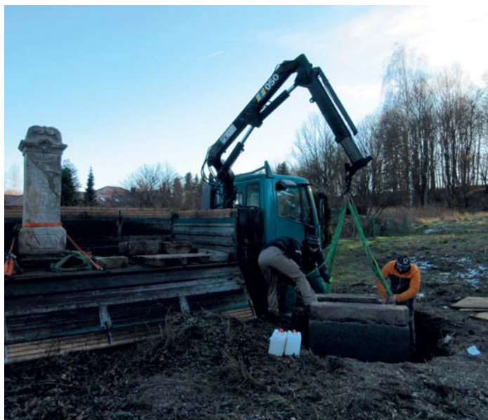
Probíhá rekonstrukce dalších sakrálních památek na území města