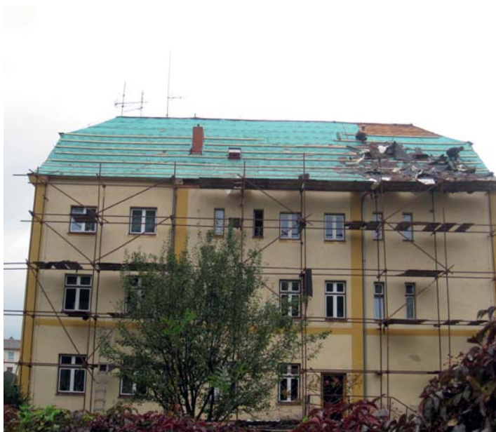
Oprava střechy Smetanova 2