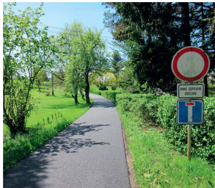
Rekonstrukce místních komunikací