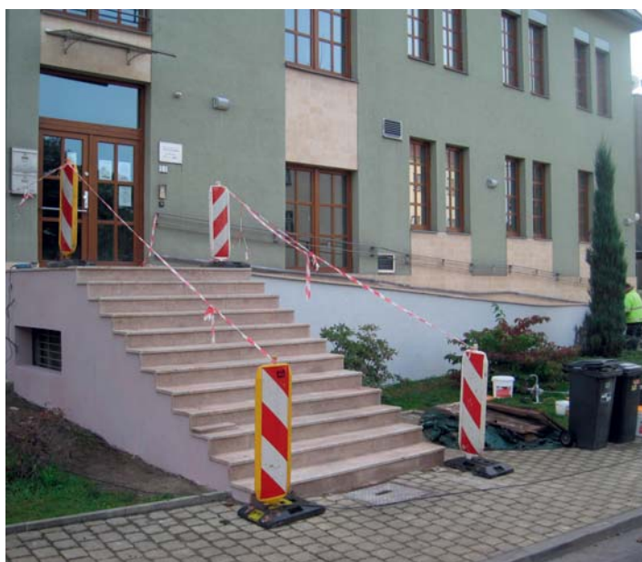
Rekonstrukce schodiště u Domu ČS