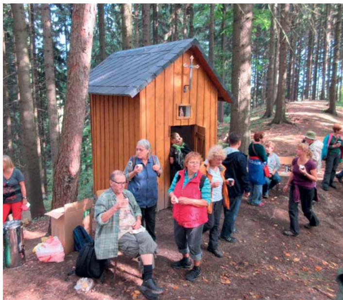
Rekonstrukce lesní kaple sv. Anny