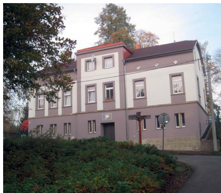
Mánesova 24 - dům po rekonstrukci