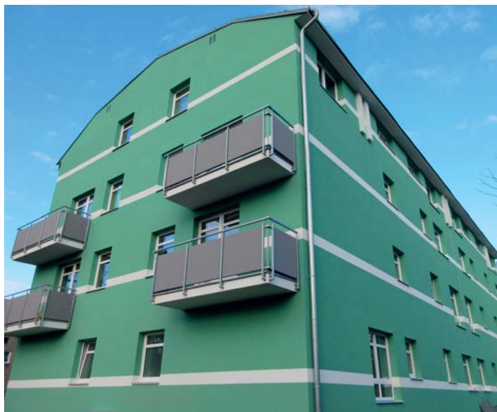
Rekonstrukce a zateplení bytového domu Nemocniční 6