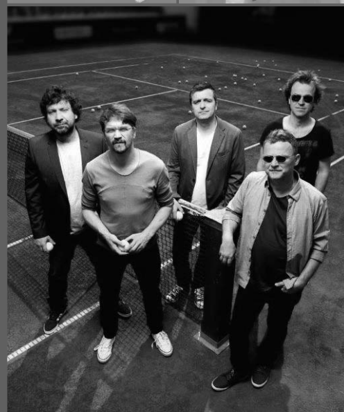
Dan Bárta & Illustratosphere