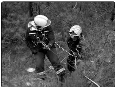
Krásnolipští hasiči vyrazili do Kyjovského údolí, aby prožezali Kinského vyhlídku.