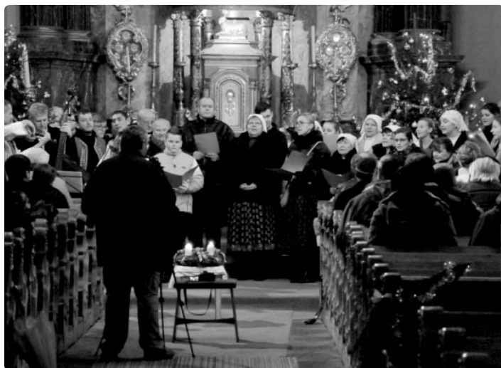
...tradicí jsou také třetí a čtvrtý adventní koncert folklorních souborů Lužičan a Dykyty