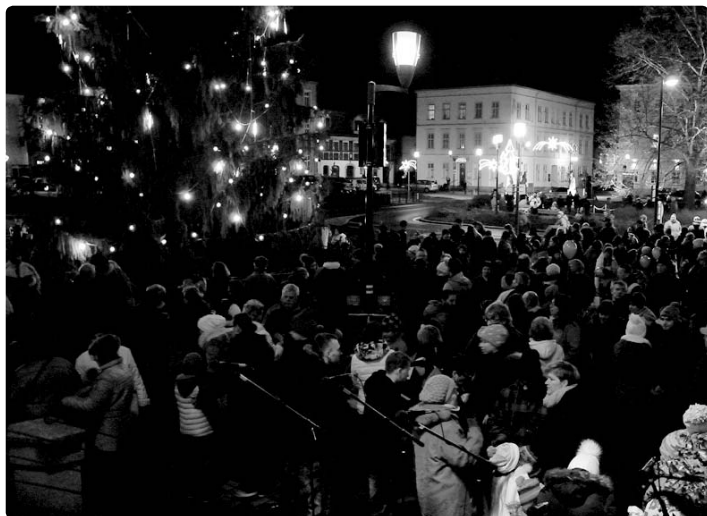
...vše začalo rozsvícením vánočního stromu a společným koncertem Krásnolipského komorního sboru a sboru Gaga z Povrl