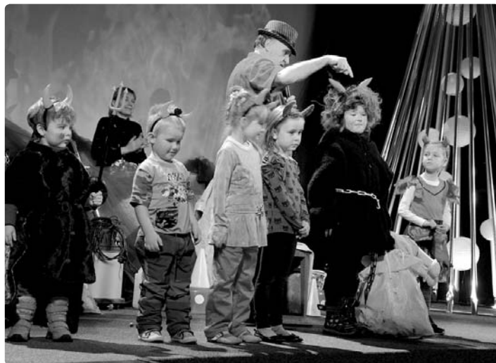
...potom si v kulturním domě zařídili čerti a čertice při čertovské diskotéce