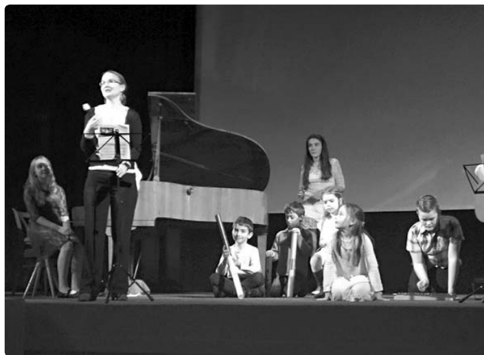
...adventní koncertování uzavřel koncert budoucích umělců ze ZUŠ Krásná Lípa