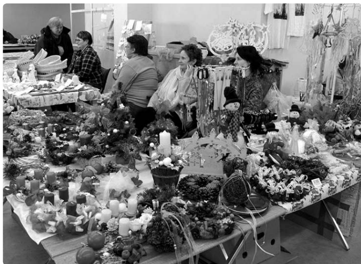
...ke krásnolipskému adventu patří i turistické adventní trhy a prodej vánočních stromků