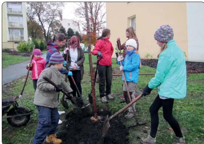
Novou alejí sakur se dojde z centra Krásné Lípy na zdejší sídliště.