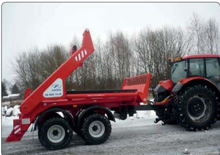
I letos pokračuje obnova techniky pro Technické služby. Pořídili jsme téměř za 1 mil. Kč nový kontejnerový nosič.