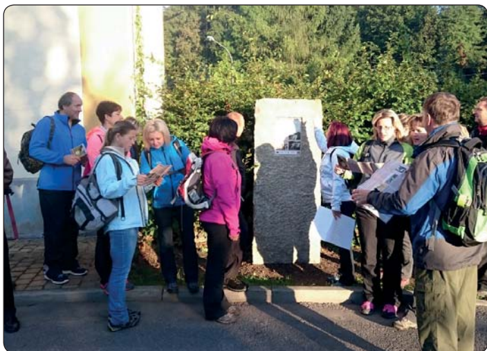
Krásná Lipa má novou naučnou stezku „Po stopách Augusta Frinda“, její návštěvníci mají k dispozici česko-německé letáky s krátkými texty a mapkou celé trasy.