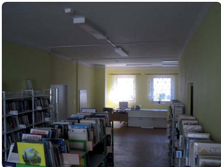
Knihovna po rekonstrukci.