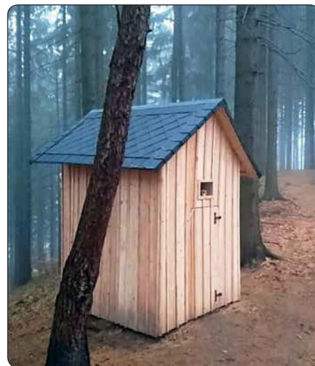
Krásnolipský klub českých turistů, ve spolupráci s městem Krásná Lípa a s řadou dobrovolníků opravil lesní kapličku sv. Anny nad Dlouhým Dollem.