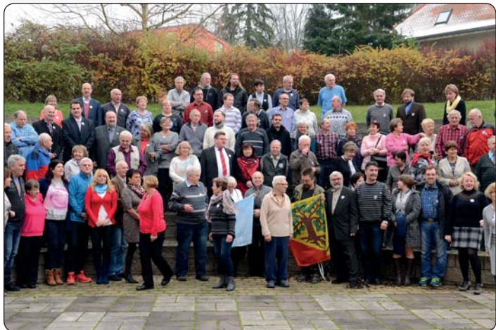
Krásnolipští turisté oslavili 35 let své činnosti. Je to jeden z neaktivnějších odborů nejen v našem městě, ale i v České republice.