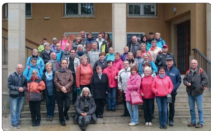
Členy aktivních organizací pozvalo město do Prahy, kde navštívili Senát ČR, planetárium a ZOO.