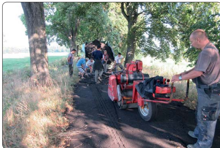
Město opravilo komunikaci na Skřivánčím Poli ve směru do Zahrad a Starých Křečan.