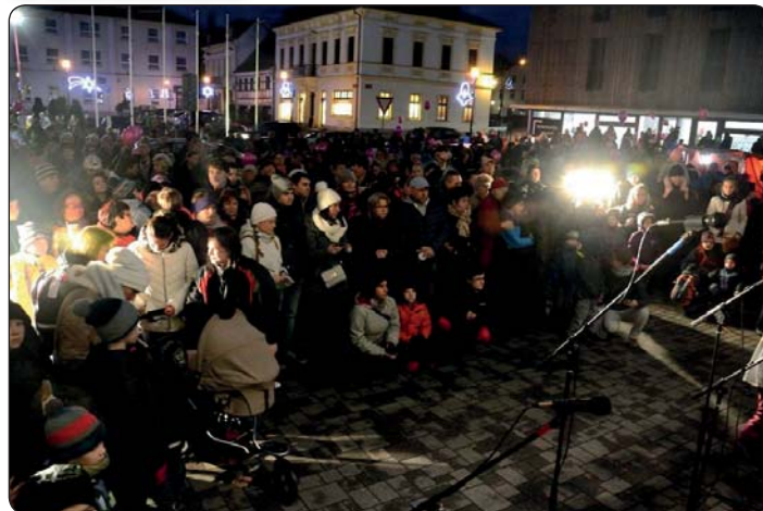
...a opět jsme rozsvítili vánoční strom, zazpívali koledy a poslali přáníčka ježíškovi.