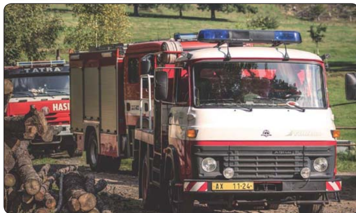
Nový přírůstek SDH.