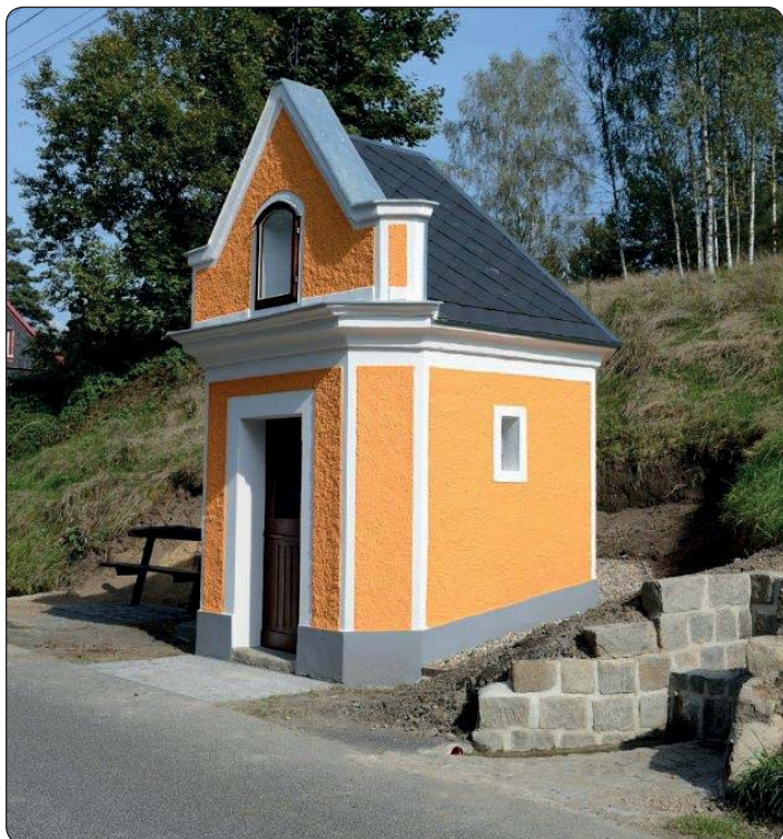
Opravená kaplička v Kyjově.