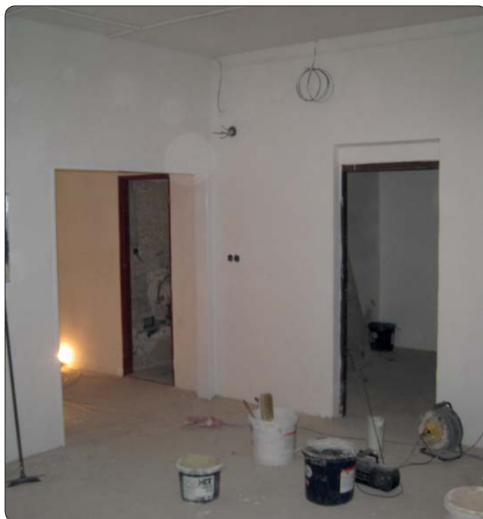
Rekonstrukce prádelny Količek v domě služeb.