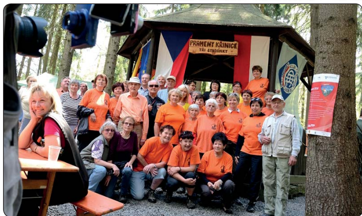
U pramenů Krinice v Krásné Lípě se setkali turisté z celé ČR i zahraničí v rámci akce Euroorando.