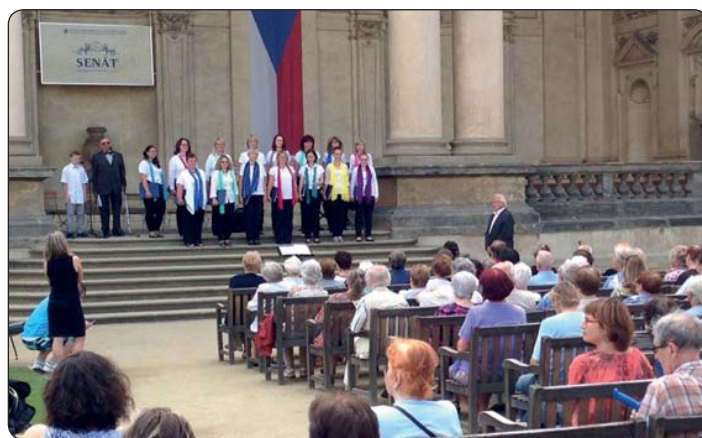
Krásnolipský komorní sbor zpíval v senátu.