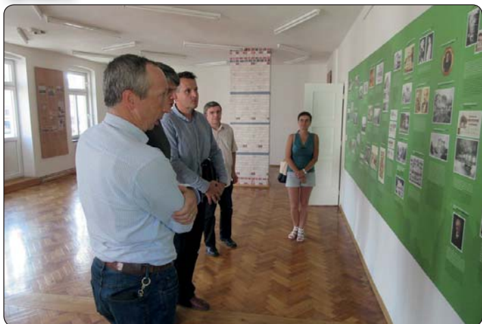
Problematika školní inspekce a ombudsmankou kritizované rozdělení žáků loňských prvňáčků - to byla některá z probraných témat při návštěvě Václava Klause ml.