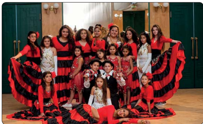
Kostka v rámci týdne sociálních služeb uspořádala v kulturním domě taneční mini-festival.