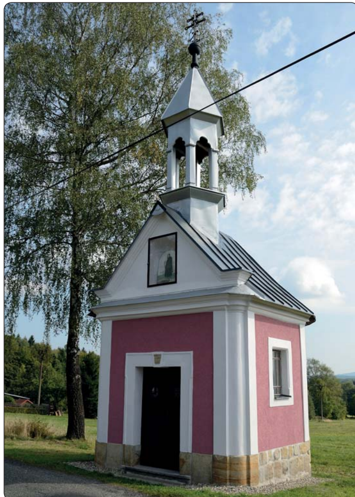
Opravená kaplička v Zahradách.