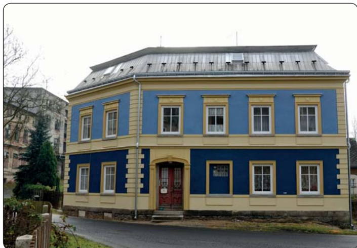
Nová fasáda a okna - Kyjovská 53.