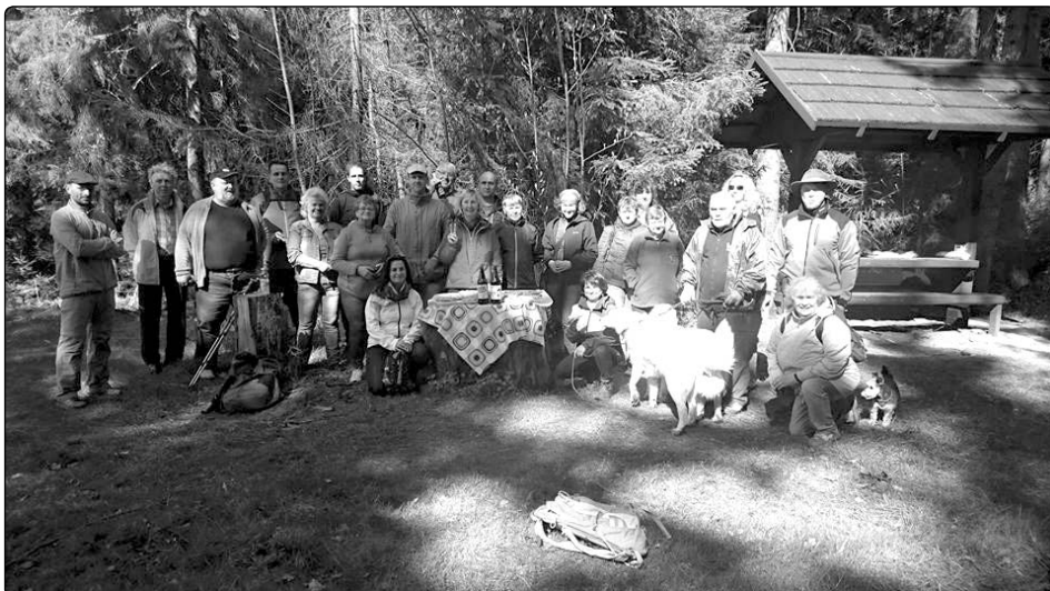
Výlet na Maškův vrch u Krásné Lípy zahájil turistickou sezónu v Českém Švýcarsku i Krásné Lípě. Pochod měl nejen otevřít turistickou sezónu, ale i podpořit výstavbu nové rozhledny, kterou připravuje město Krásná Lípa spolu s Klubem českých turistů. O občerstvení se postaral Klub českých turistů z Krásné Lípy.