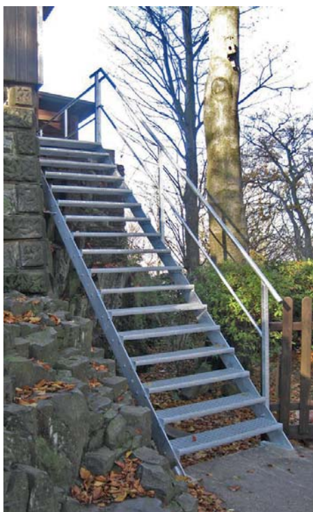
Nové schody na rozhlednu Vlčí hora