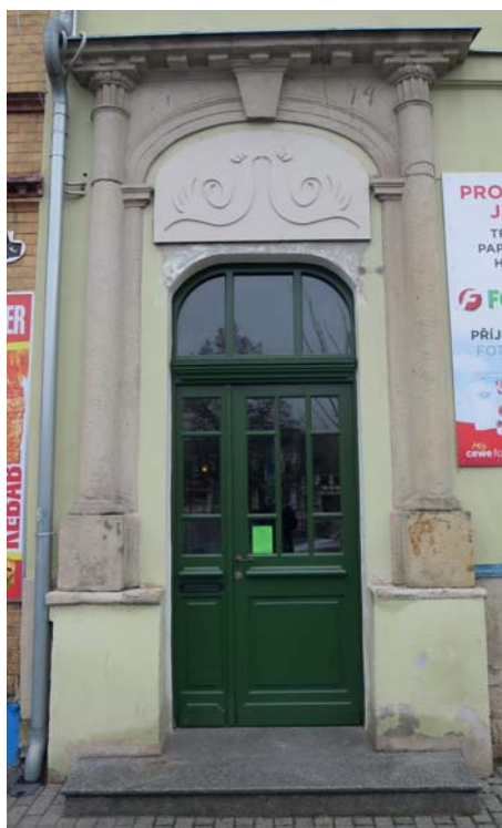
Výměna dveří Křinické náměstí 16