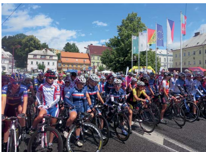
Tour de Feminin