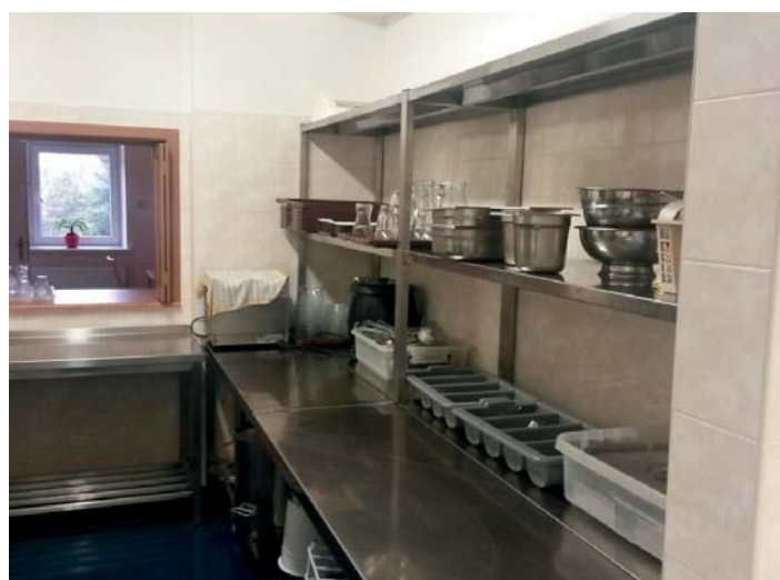
Výdejna obědů ve školní jídelně po rekonstrukci