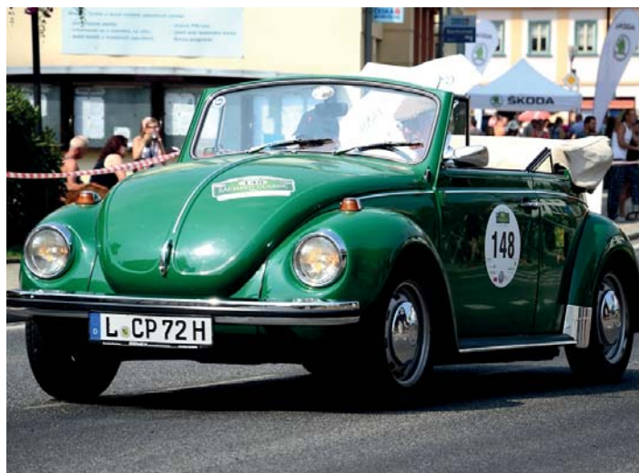
Sachsen Classic 2015