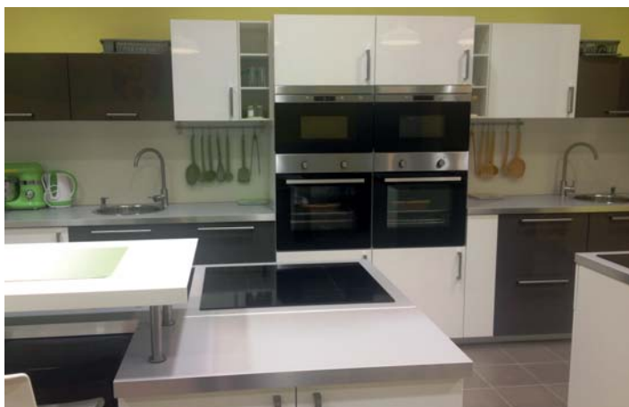
Nová učebna kuchyňky v ZŠ