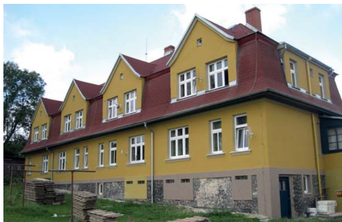
Opravený bytový dům Bezručova 15