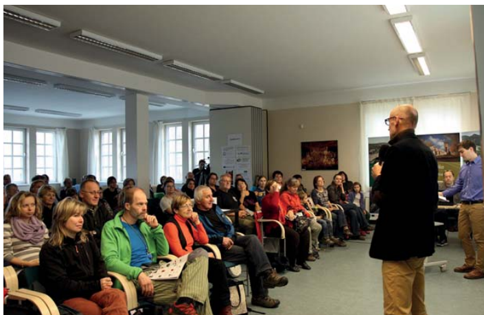
Cestovatelský festival 7 divů