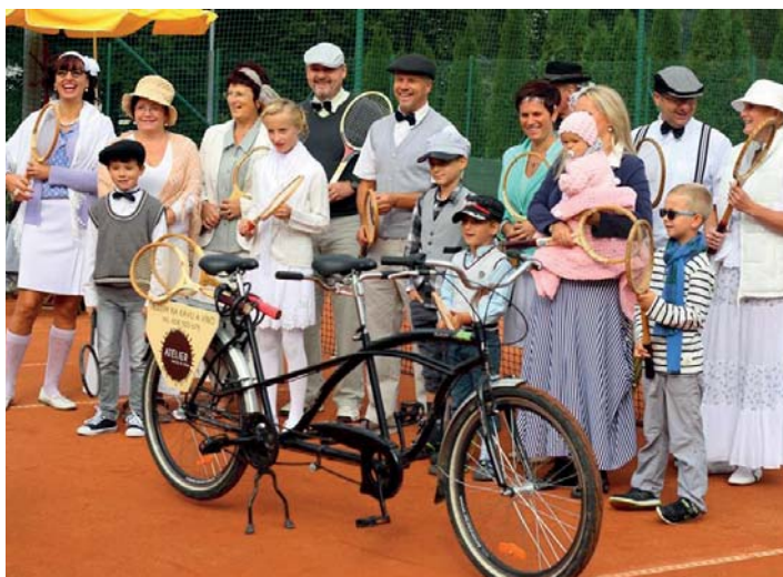
Retro turnaj v tenise