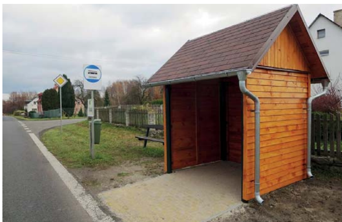
Autobusová zastávka na Rumburské ulici