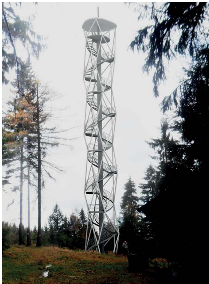
Možná budoucí rozhledna na Maškově vrchu