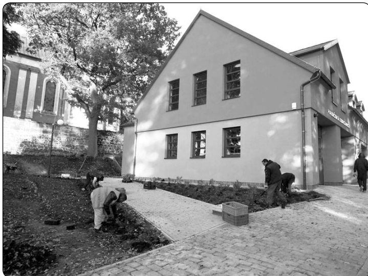
Technické služby města a pracovníci veřejně prospěšných prací dokončují sadovnické úpravy okolo zrekonstruované hasičské zbrojnice.

Město Krásná Lipa • Masarykova 246/6 • 407 46 Krásná Lipa tel.: 412 354 820, mobil: 774 930 300, e-mail: podatelna@krasnalipa.cz IČ: 00261459 • Banka ČS, a.s., Rumburk, č.ú.: 926075399/0800