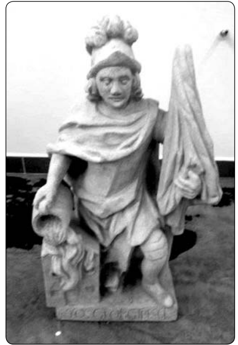
Novou hasičárnu našim dobrovolným hasičům pohlídá Svatý Florián, patron hasičů.