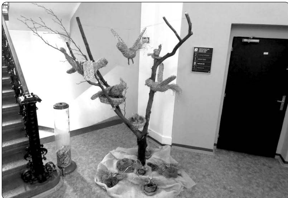
Velikonoce se blíží, krásnolipští zahradníci se činí a zdobí.