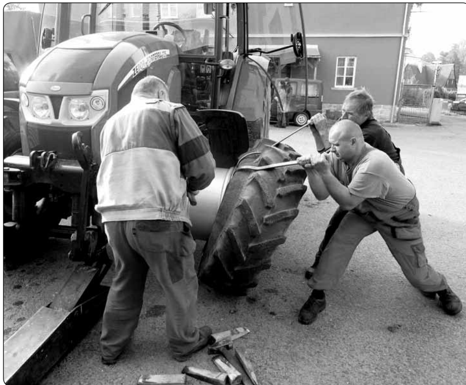
Babi léto je fuč - nezapomeňte přezout!

Jako pomoc občanům, kteří nemají možnost spadlé listí kompostovat svépomocí, nabízí město Krásná Lípa již tradičně jeho bezplatný odvoz. Ke shromáždění spadaného listí slouží velkoobjemové pytle, které vám zdarma zapůjčíme v Technických službách. Po naplnění pytlů stačí jen telefonicky (pí. Kamberská, 412 354 848) objednat jejich odvoz.