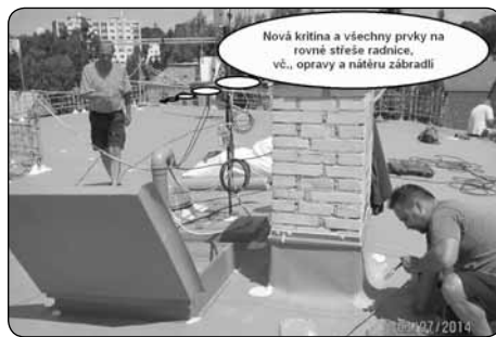
Nová kritina a všechny prvky na rovné střeše radnice, vč., opravy a nátěru zábradlí

Katalog sociálních služeb kostka@krasnalipa.cz