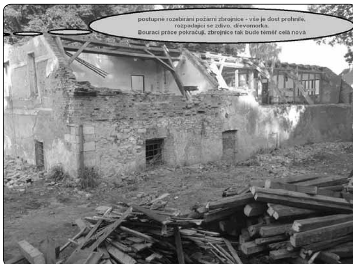
postupně rozebírání požární zbrojnice - vše je dost prohněle, rozpadající se zdivo, dřevomorka. Bourací práce pokračují, zbrojnice tak bude téměř zcela nová