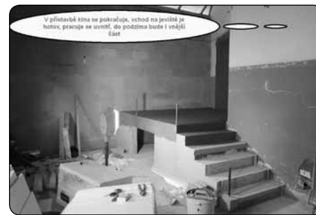
V pilotních křídle se pokračuje, vchod na javitě je hotov, práce se určí, dle postřehů bude i vnější část