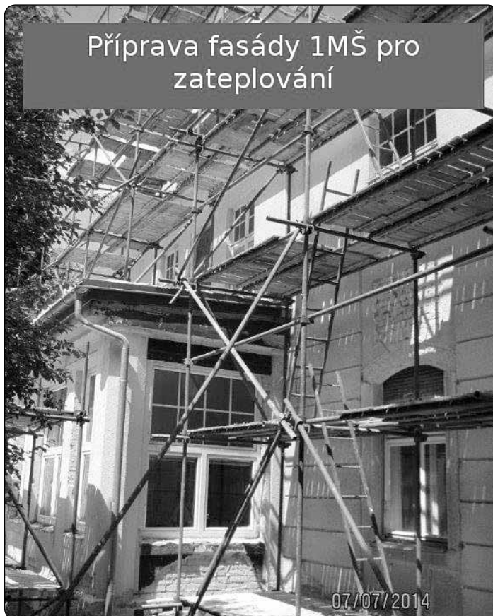
Příprava fasády 1MŠ pro zateplování