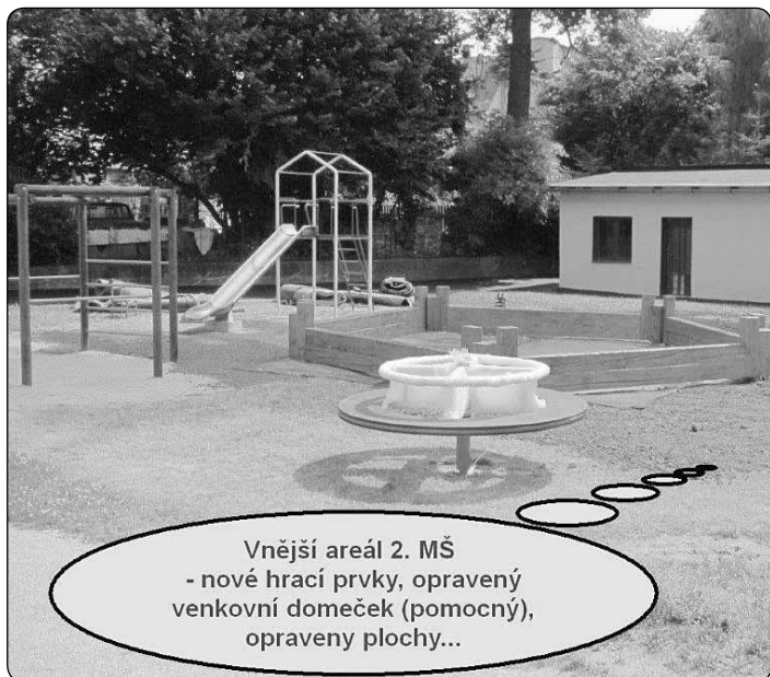
Vnější areál 2. MŠ - nové hrací prvky, opravený venkovní domeček (pomocný), opraveny plochy...