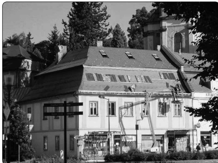
Střecha cukrárny (budova v majetku města) na Křínickém náměstí prochází zásadní rekonstrukcí.