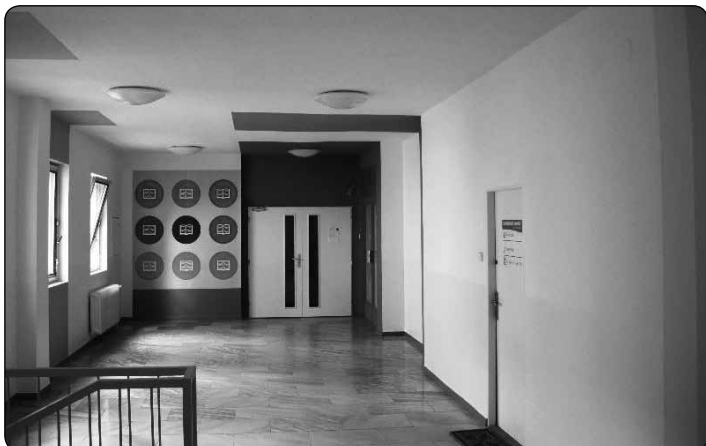
Už jste byli v knihovně? Dům služeb se mění uvnitř, brzy se promění i zvenčí.