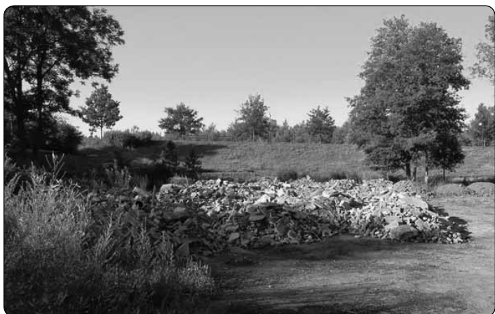
Stavební suť z požární zbrojnice uložená pod kinem se vytrídí, rozdrtí a použije jako podklad pro plochu budoucího skejtového a volnočasového hřiště a parkoviště, které zde vznikne.