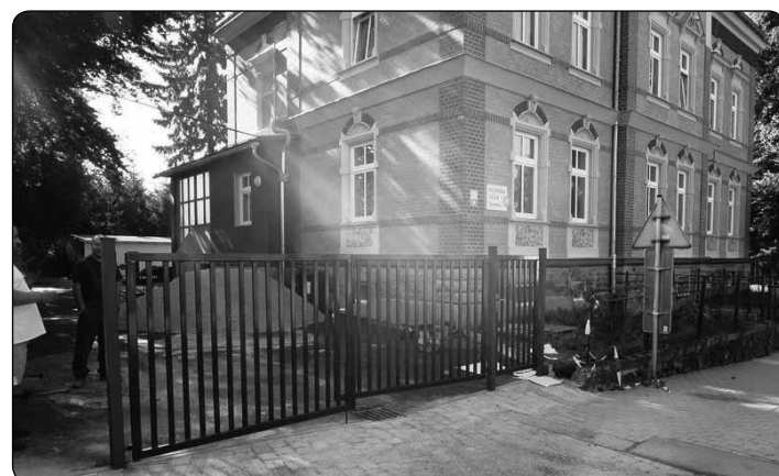
Nová vstupní brána MŠ Sluníčko z dílny našich Technických služeb.