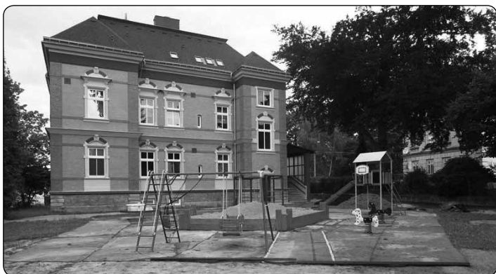
Úpravy zahrady a hracích ploch MŠ Sluníčko jdou do finále.