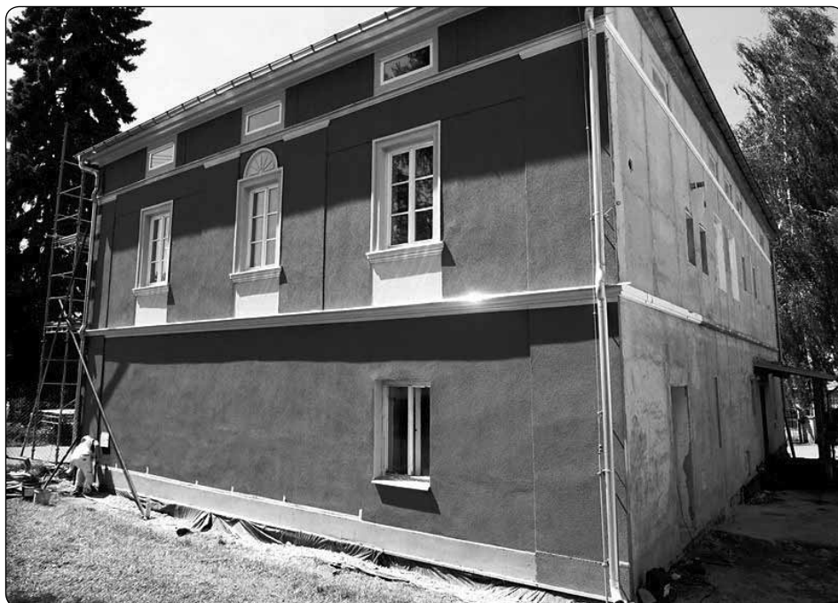
Budova Technických služeb se začíná vybarvovat do zelena.