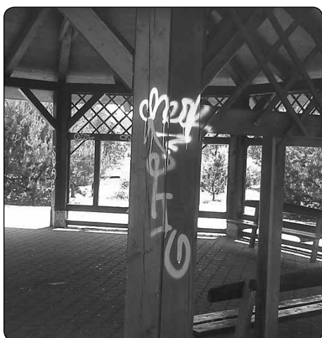
Dílo neznámého primitiva z počátku 21. století.