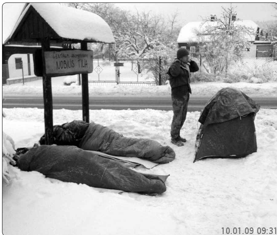
O zimním stanování z roku 2009 si mohli spáčů roku 2014 nechat alespoň zdát.