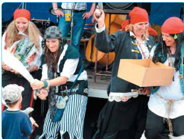
Tradici i úspěšnost má turistický pohádkový les