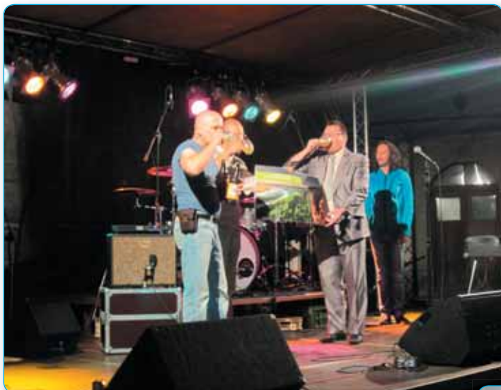
Den Českého Švýcarska - připitek „našim“ pivem Falkenštejn