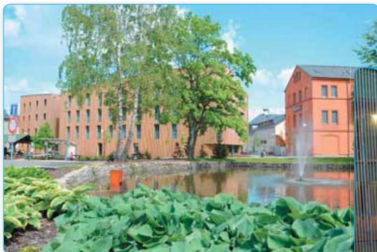
Letošní rok byl ve znamení soukromých investic v centru města - Rozšiřování Lípa resortu a Křinického pivovaru