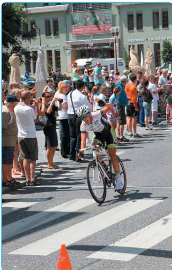
Každoročně začátek prázdnin patří cyklistickému závodu Tour de Feminin