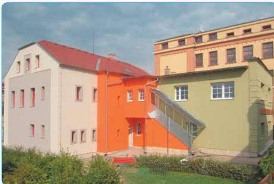
Školní jídelna je po rekonstrukci k nepoznání