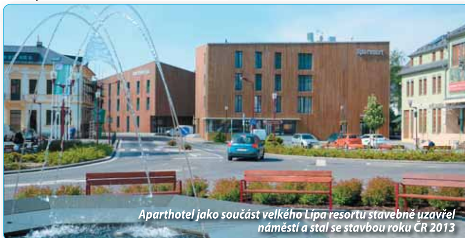
Aparthotel jako součást velkého Lipa resortu stavebně uzavřel náměstí a stal se stavbou roku ČR 2013