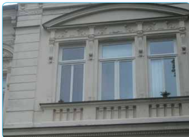
Budova radnice se postupně modernizuje, i okna jsou z velké části nová