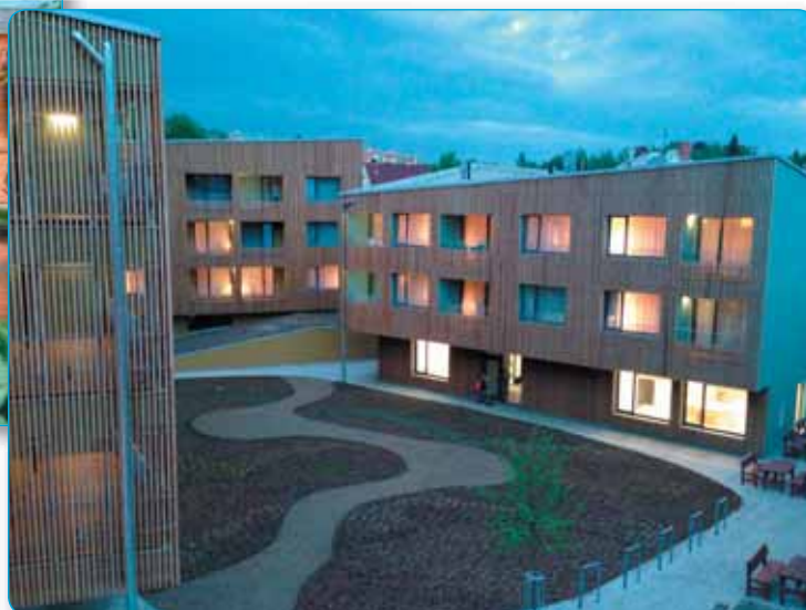
Aparthotel večer při pohledu z Továrny