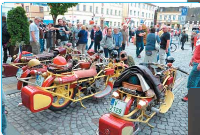
Každoroční sraz Čechie - Böhmerland 31. 8. 2013