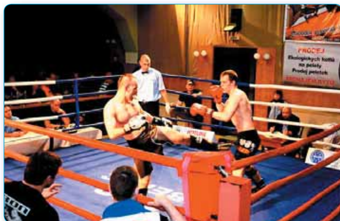
Nejen kulturou je živo kino. V dubnu jste v něm mohli vidět souboje Národního poháru v kickboxu