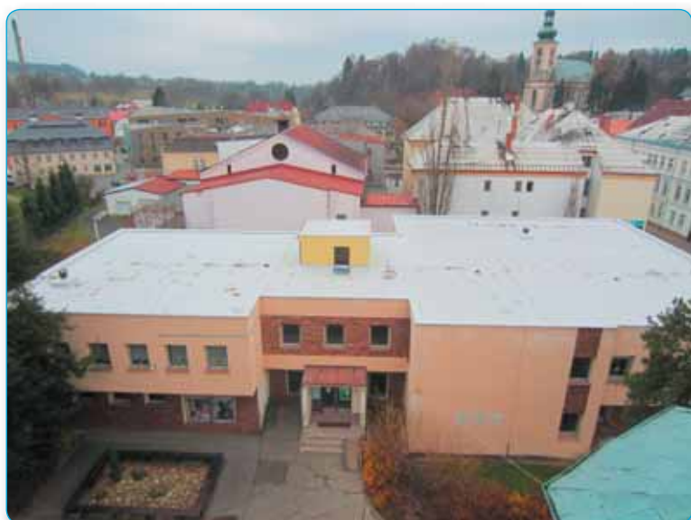
Dům služeb má novou zateplenou střechu a novou plynovou kotelnu