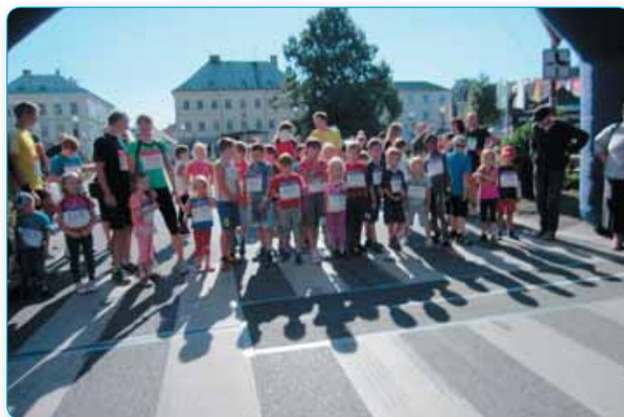
Parkmaraton - to jsou i populární dětské tratě