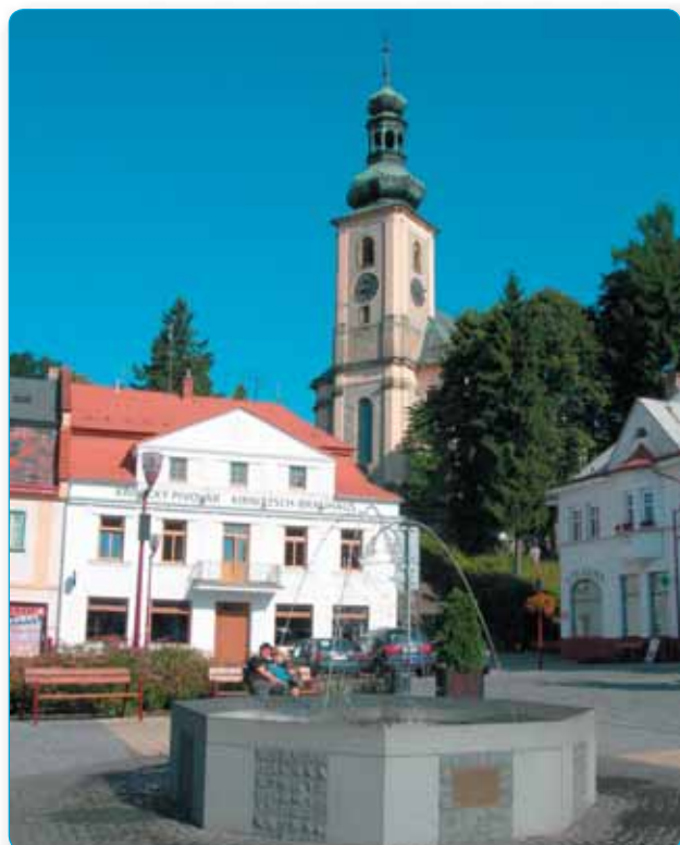
O prázdninách se roztočily pípy nového Křinického pivovaru na náměstí s pivem Falkenštejn