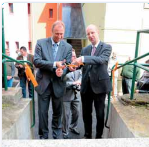
Slavnostní otevření ŠJ a ŠD za účasti ministra životního prostředí ČR

Objekty školní družiny a školní jídelny prošly rekonstrukcí