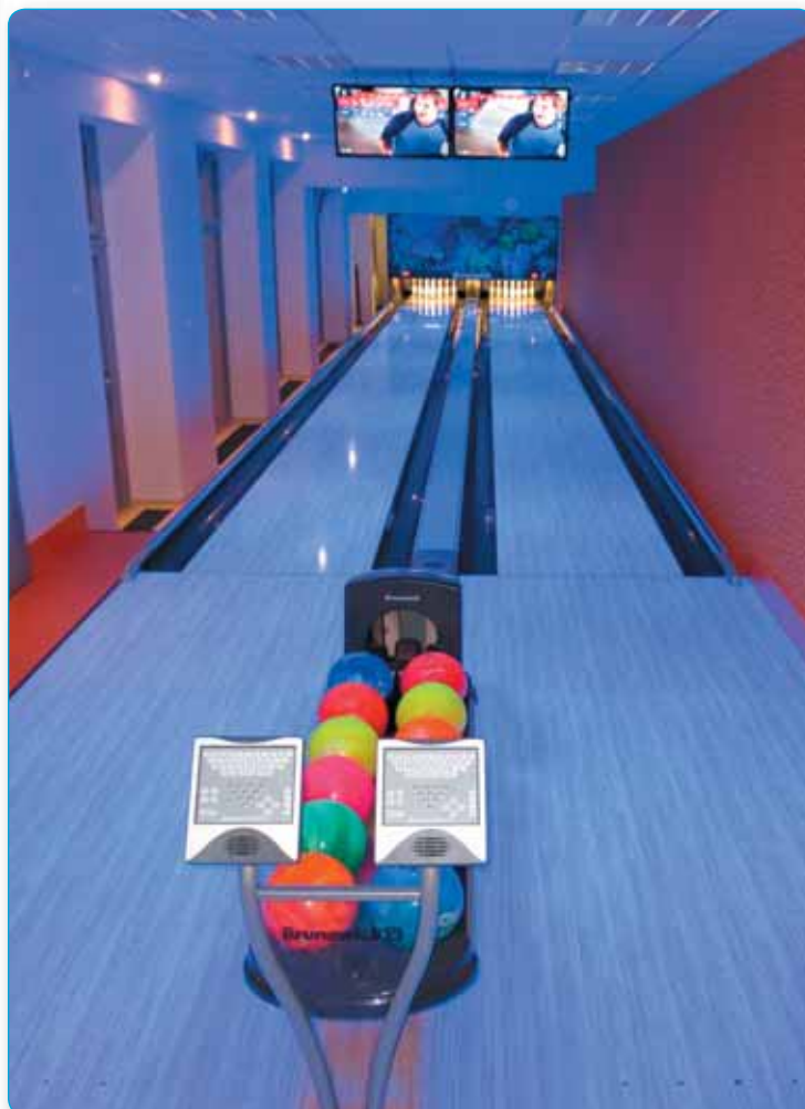
Špičkový bowling v přístavku Továrny byl dokončen v závěru roku