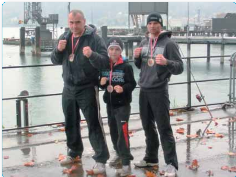
Naši kickboxeři vozi stále cenné medaile