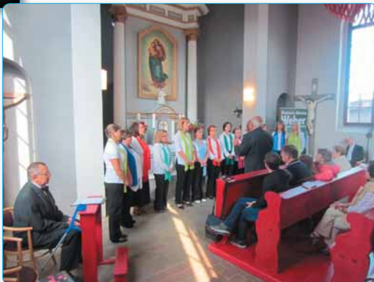
Krasnolipský komorní sbor se stal ozdobou mnoha kulturních akcí ve městě.