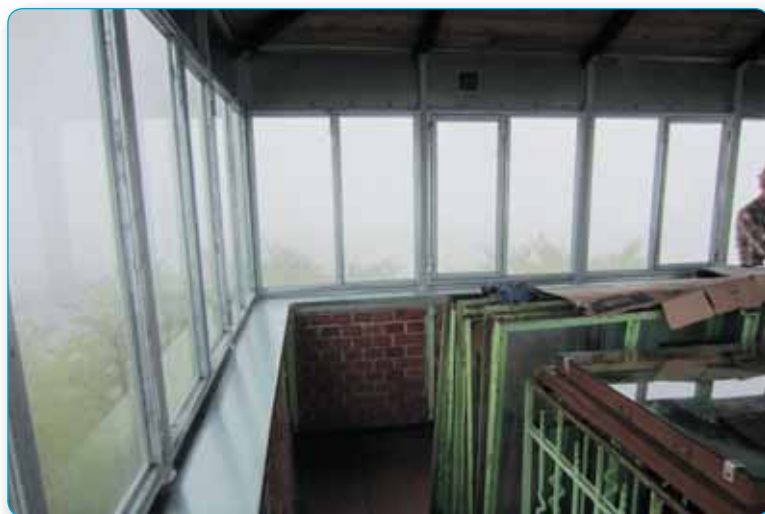
Ve spolupráci s turisty byla vyměněna okna a vylepšen interiér na vlčihorské rozhledně