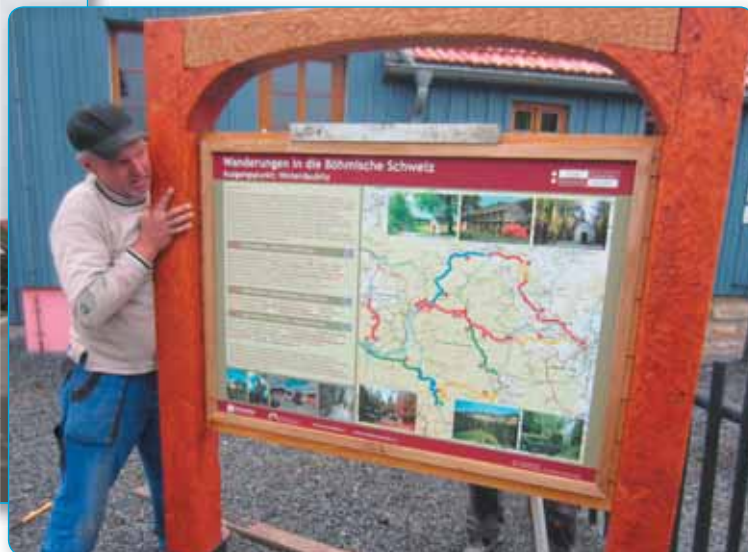
Pokračujeme v propagaci turistických cílů v našem okolí a v Sasku