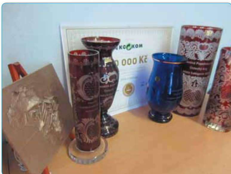
Ve třídění odpadů jsme nejlepším městem v Ústeckém kraji