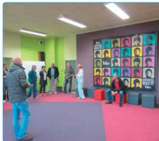
Škola přes prázdniny prošla opět velkou proměnou