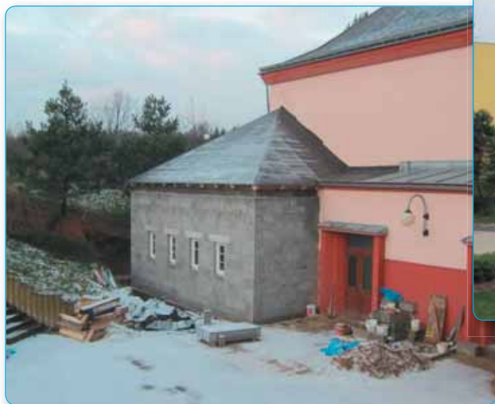
Přístavba kina umožní boční vstup na jeviště a vzniknou další prostory

... snažíme se dělat vše proto, aby se nám v našem městě žilo přiměřeně dobře a lépe.