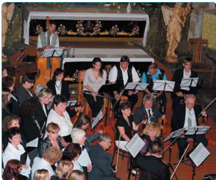
V letošním roce i díky rekonstruovaným varhanům ožil kostel sv. Máří Magdaleny