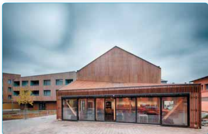
Moderní přístavba restaurace penziny doplňuje areál Lípa resortu