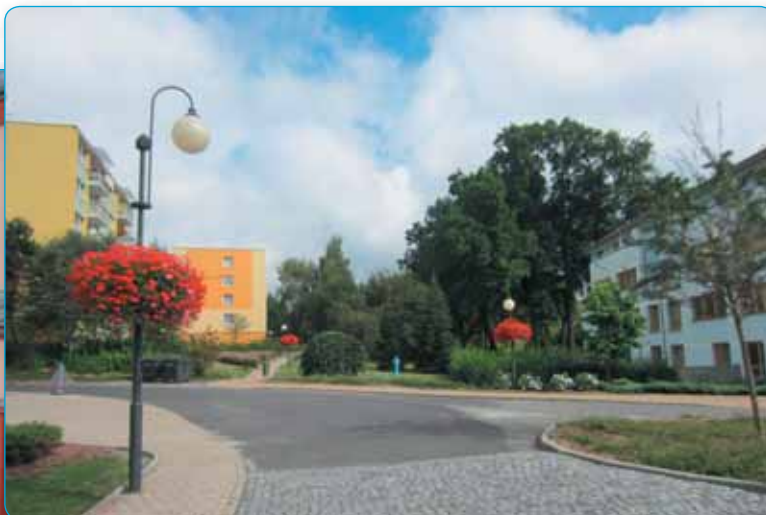
Městská zeleň dotváří příjemnou tvář města i na sídlišti