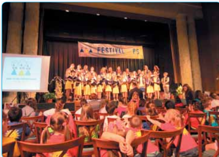
28. ročník festivalu DPS - úspěšně obnovená tradice