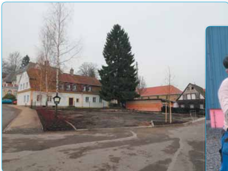
Proměnou prochází i odstavná plocha ve Smetanově ulici