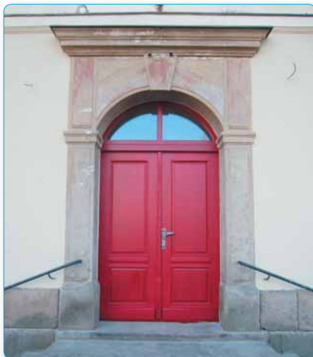
Postupně opravujeme naše domy na náměstí, nové dveře z masivního dřeva v objektu Křinické náměstí 1