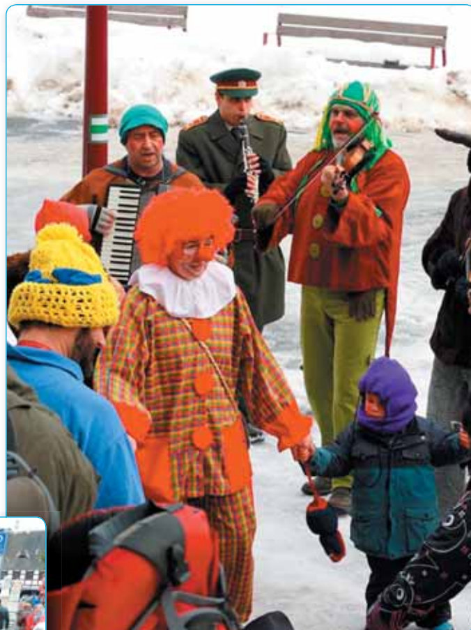
Na konci zimy prošel městem masopustní průvod masek