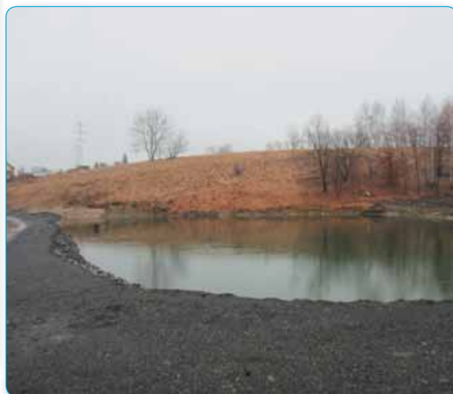
Revitalizovali jsme rybník Smutňák