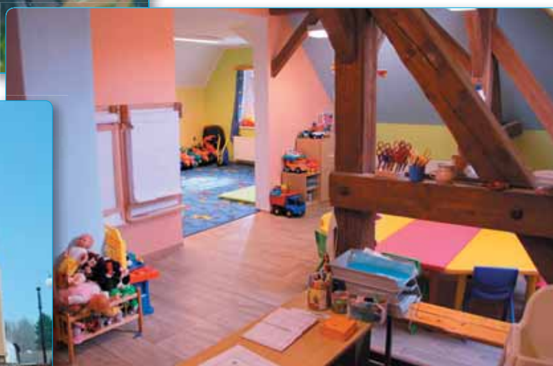
Zrekonstruované podkroví školní družiny slouží mj. jako zázemí Berušky

Objekty školní družiny a školní jídelny prošly rekonstrukcí