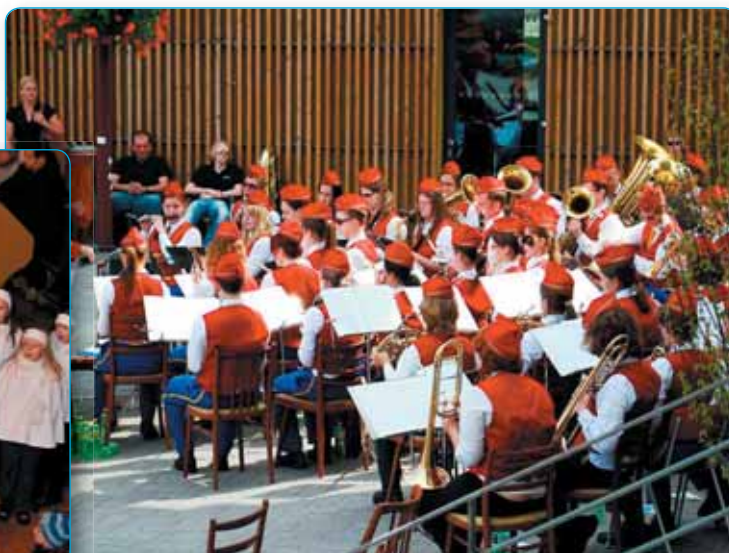
Mezinárodní dechový festival dne 22. 6. 2013 byl příjemným zpestřením