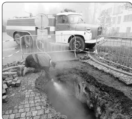
Sklepy bývalého pivovaru se opět připomněly. Propad v komunikaci před Nemocniční 6 opravili pracovníci technických služeb.