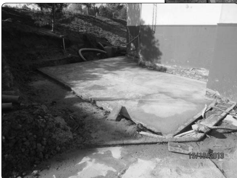
základy přístavby kina