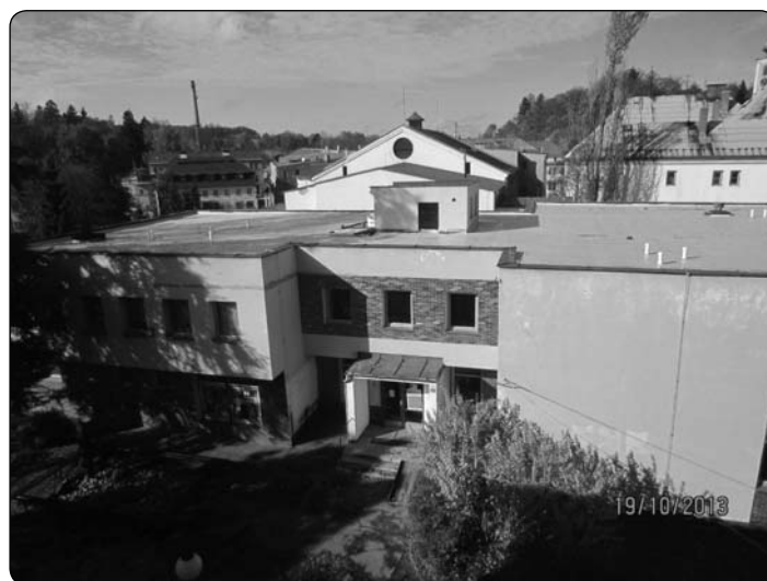
střecha na DS folie zatepelní dokončování