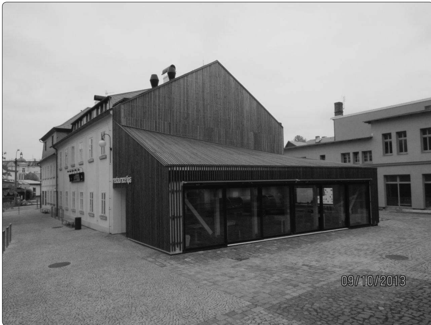
přístavba restaurace Penzionu ČŠ