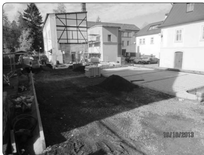
stavba parkoviště Pražská půlka a fasády v pozadí