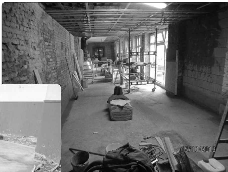
přístavek Továrny _budoucí bowling