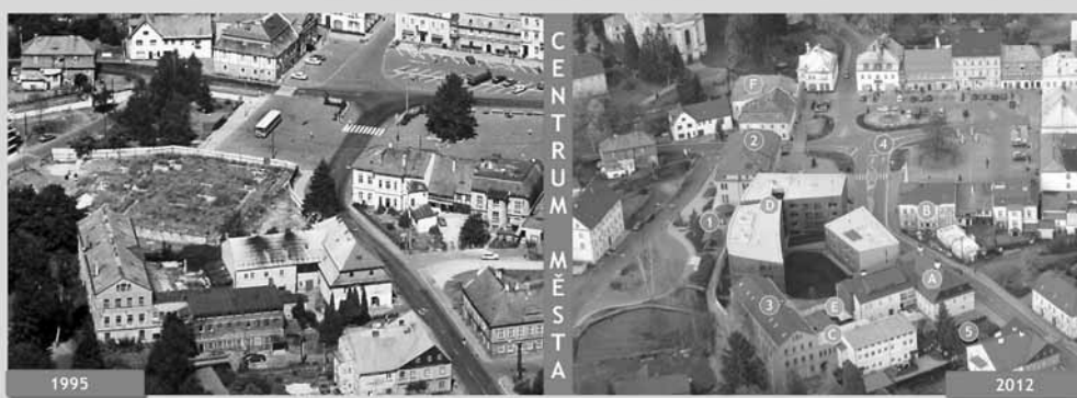
MINULOST - SOUČASNOST - BUDOUCNOST