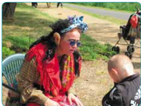
Pohádkový les zpestřuje každé jaro již mnoho let