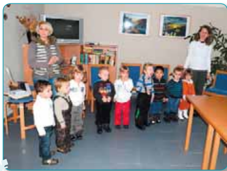
Vánoční besídka s našimi seniory v Domě s pečovatelskou službou