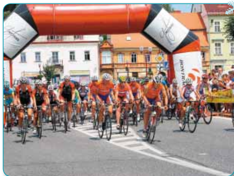
Tour de Feminin se jelo po pětadvacáté