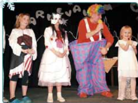
Tradiční dětský karneval pro naše nejmenší