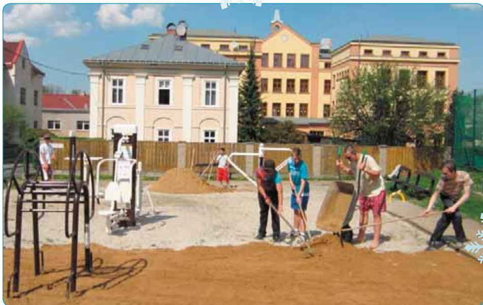
Sportovní nabídka se rozšířila o venkovní fitness na Hauserce