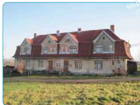
Pokračovaly investice v bytových domech - např. nová střecha Bezručova 15