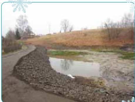
Jeden z opravených rybníků - Smuťňák