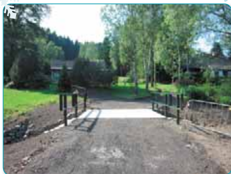
Proběhla obnova čtyř mostků přes Křinici