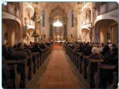
Opravené varhany opět znějí v krásnolipském kostele