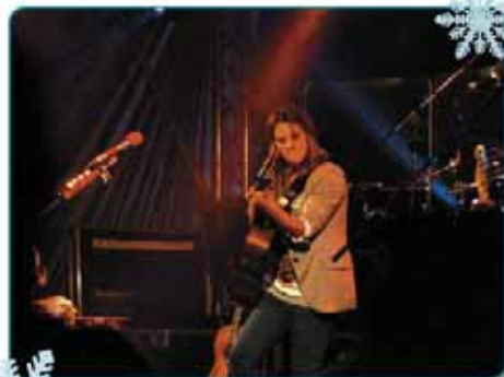
Koncertem Anety Langerové vyvrcholil Den Českého Svýcarska