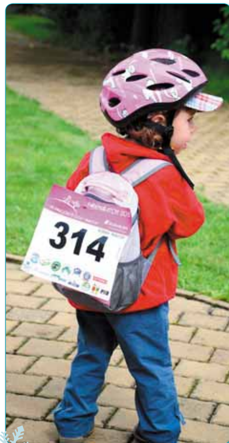
Parkmaraton měl rodinnou i dětskou trať