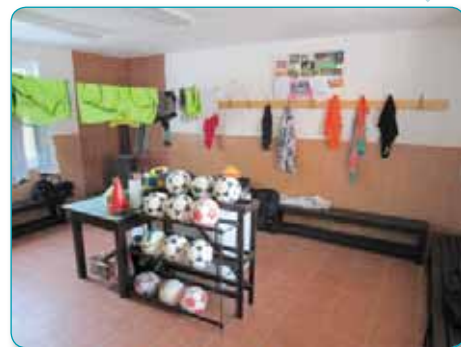
Kabiny na fotbalovém hřišti prošly rekonstrukcí