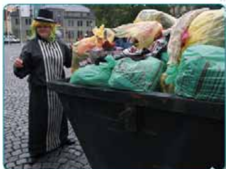
Ekolýden - pobavil i poučil