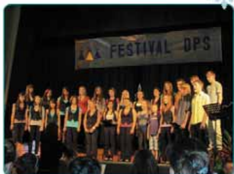
Obnovená tradice - Festival dětských pěveckých sborů