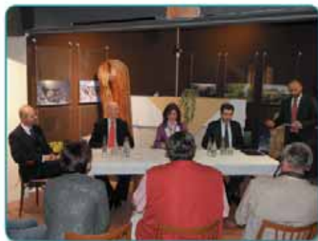
Krásnou Lípou navštívili velvyslanci USA a Norska