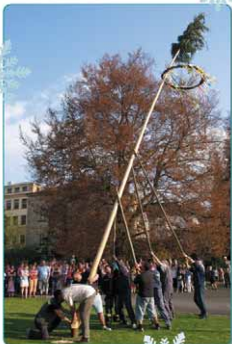
Májku připravili Technické služby a postavili hasiči