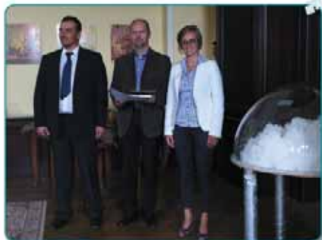
V třídění odpadů jsme v Ústeckém kraji třeťí