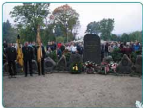
Památník občanů Zahrad padlých v 1. sv. válce obnovili krásnolipští turisté a město