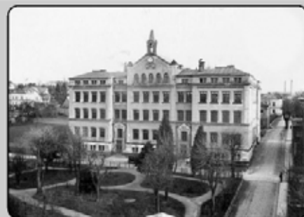
V roce 1823 nechala na náměstí v Krásné Lípě postavit novou školní budovu hraběnka Marie Karolína Kinská. Vyučovat se v ní začalo v roce 1825 a vyučovalo se zde do roku 1871, kdy se do budovy nastěhoval městský úřad. 30. dubna 1870 byl položen základní kámen nynější školní budovy, a již 27. listopadu 1871 bylo zahájeno školní vyučování. V roce 1886 došlo k rozšíření školní budovy přístavbou dvou křídel a bylo zavedeno ústřední topení. Škola měla dvacet jedna tříd a navštěvoval ji devět set čtyřicet žáků.

Krásná Lípa vyhlašuje VYBĚROVÉ ŘÍZENÍ na obsazení pracovní pozice – referent společné státní správy a samosprávy do odboru výstavby, investic a životního prostředí – odpadové hospodářství. Uchazeč podá písemnou přihlášku v uzavřené obálce s označením: „Výběrové řízení - referent odboru výstavby, investic a životního prostředí – neotvírat“ do 31.1. 2013. Více informací na webu města www.krasnalipa.cz .