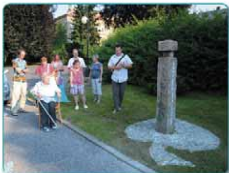
Dvě veřejná prostranství mají nové názvy - Sady Karla Hiekeho a Náměstíčko Dr. Richarda Klose