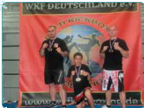
Máme mistry světa v kick boxu