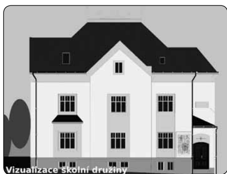
Vizualizace školní družiny

Město Krásná Lípa vyzývá zájemce o veřejnou zakázku na realizaci úspor energie u budov školní jídelny a školní družiny v Krásné Lípě. Výzvu s dalšími informacemi můžete stáhnout na www.krasnalipa.cz .