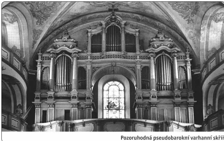
Pozoruhodná pseudobarokní varhanní skříň