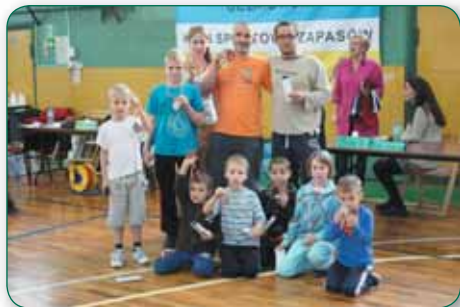
Krásnolipští zápasníci vozí cenné medaile z republikových závodů