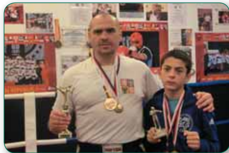
Mistři České republiky v kickboxu a klasickém boxu