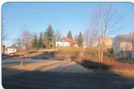
Jarní tání opět rozvodnilo Křiinici v Kyjově