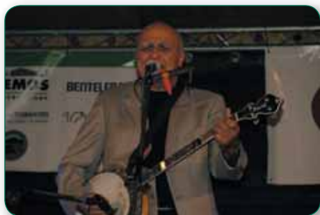
Záříjový Den Českého Švýcarska uzavřel večerním vystoupením Ivan Mládek a jeho Banjo band