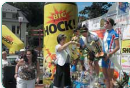
Petrobarevné startovní pole cyklistek tradičně ožívuje prázdninovou Krásnou Lípou i celý Šluknovský výběžek