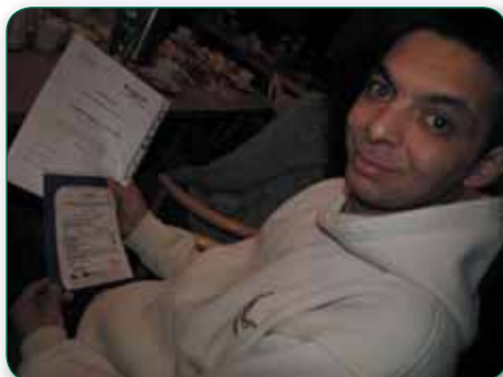
Projekt Mám práci vzdělával i zaměstnával sociálně vyloučené spoluobčany