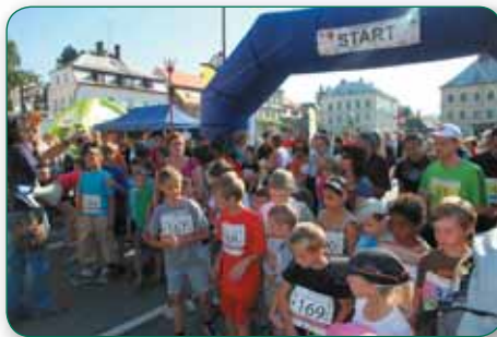
Parkmaraton měl letos poprvé i dětské tratě