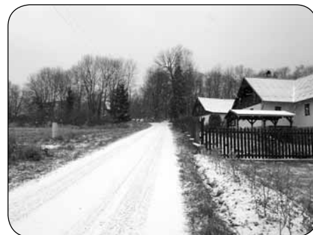
Prvního letošního sněhového poprašku se Krásná Lípa dočkala v úterý 6. prosince.