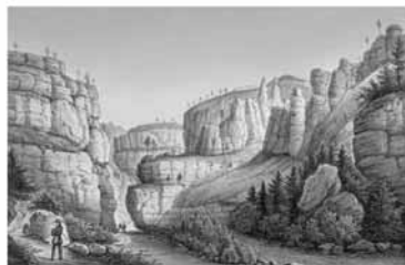
ČESKOSASKÉ ŠVÝCARSKO NA HISTORICKÝCH VEDUTÁCH 2012 DIE SAISONENDE BOHEMISCHER SCHÖNHEIT AUS HISTORISCHEN VEDUTEN 2012

Letos jako bonus přikládáme malý doprovodný stolní kalendář (17x20 cm), který zahrnuje výběr dalších třinácti vedut v elegantním černobílém provedení s doprovodnými texty o historii nejnámějších zobrazených míst jako je Pravčická brána, Hřensko, Jetřichovické skály, Děčinský zámek, Bastei, nebo Königstein. (Formát: 5 60 cm x 42 cm)