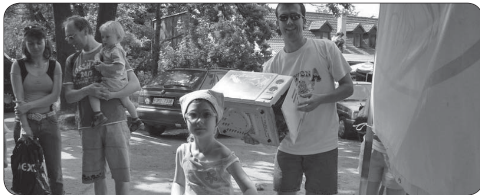
Řada lidí využívá možnosti odevzdat elektrospotřebiče v rámci speciálních akcí.

Už od roku 2006, kdy byl proveden první ze tří průzkumů, roste kontinuálně podíl respondentů, kteří hodnotí své informace o zpětném odběru elektrozařízení jako dostačující. Letošní průzkum přesto ukázal, že je ještě co zlepšovat i v této oblasti. Přibližně třetina dotázaných si totiž stále myslí, že některé malé spotřebiče patří do běžné popelnice nebo do kontejneru na tříděný odpad.