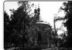
č. 383 - krásnolipský kostel sv. Máří Magdaleny