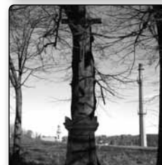
č. 385 - Marschnerův též Ramischův kříž u fotbalového hřiště