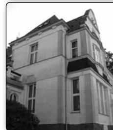
č. 384 - roh hlavní budovy dětského domova