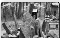
č. 380 - studánka Veronika pod Vlčí horou