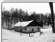
č. 369 - centrální čistička odpadních vod v Krásném Buku