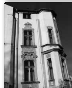
č. 388 - fragment Jägrový rodinné vily v Krásném Buku