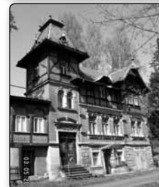
č. 387 - bývalá vila Alfreda Hiekeho - majitele pily v Krásném Buku