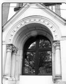
č. 377 - opravený původní vstupní portál do bývalé krásnolipské nemocnice