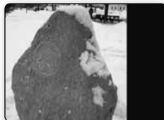
č. 373 - zelený dům 1137/6