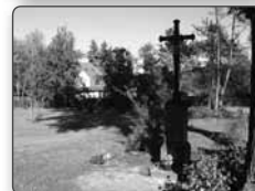
č. 386 - Palmeho kříž (Plams Kreuz) u městského hřbitova