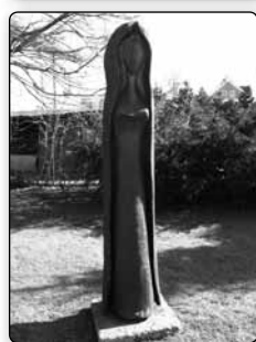
č. 375 - jedna ze 13 dřevěných soch, které zdobí různá zákoutí města