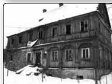
č. 368 - patrové roubené stavení č. 8 v Nemocniční ulici z roku 1830