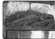
č. 382 - skulptura, kterou najdete na bývalém hřbitově za krásnolipským kostelem u severní zdi