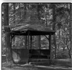
č. 372 - prameny Křinice, které tvoří tři studánky - v lese mezi Studánkou a Krásnou Lípou