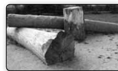
č. 381 - část dětského „Oranžového“ hřiště u rybníka Cimrák