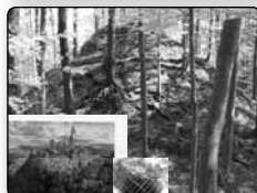
č. 374 - současný vzhled zříceniny gotického hradu v Krásném-Buku a pohledlo zreštaurovaného zbytku věže