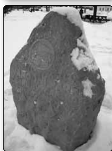
č. 370 - pískovcový blok vedle domu OPS České Švýcarsko. Další devět takových pískovcových bloků je na hlavních vstupech po obvodu hranic NP ČŠ