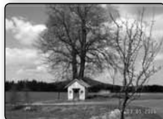
č. 376 - kaplička Nespvětější Trojice na Snežné