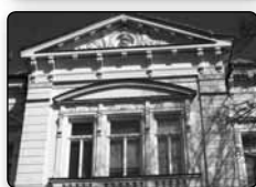
č. 379 - novorenesanční budova městského úřadu a pošty