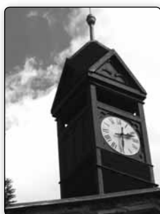
č. 367 - replika věžičky na pozdně empírovém kostelíku Panny Marie Karmelské z roku 1870 ve Vlčí Hoře

se celkem 39 soutěžících (o 13 více než loni) a 2 nejspěšnější, kteří dosáhli 22 bodů, budou odměněni přímo. Jména ostatních 37 účastníků budou slosována a 4 vylosovaní obdrží rovněž pěknou odměnu. Vyhodnocení fotokvízu se uskuteční během vánočního koncertu dne 16. prosince a odměněni budou pouze ti, kteří budou na koncertu přítomni. Fotokvíz bude s trochu pozměněnou formou pokračovat i v roce 2011.