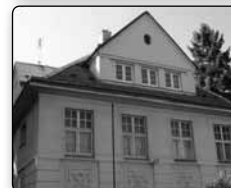
č. 385 - budova mateřské školy Motýlek ve Smetanově ulici