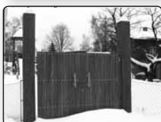
č. 371 - vstupní brána do venkovního naučného areálu u zř