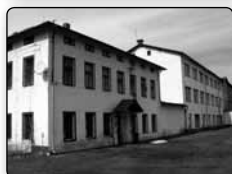
č. 378 - bývalá textilní továrna (tkalcovna a přádelna) v Zahradách