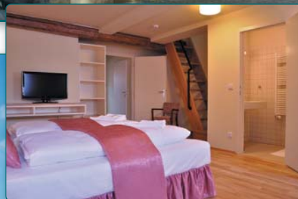
interier Penzionu - pokoj