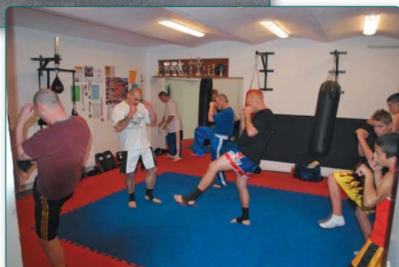
V tělocvičně trénují úspěšní zápasníci, v suterénu radnice kick boxeři.

Jízda historických aut zajela do našeho města několikrát. Vloni návštěvu znemožnila přestavba náměstí, letos nejela tato rallye v sousední části Německa. Příští rok by se měla tato nádherná auta na našem náměstí opět objevit.