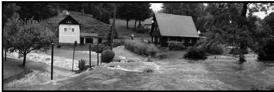
Takto rozvodnilo jinak poklidnou říčku Křiniči srpnové deštivé počasí.