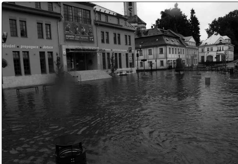
Stejně jako při povodních i po bouřce stála na náměstí voda.

Jenže dvě bouřky nestačily, přišla ještě třetí – nejsilnější. „Po druhé bouřce bylo na radarových snímcích vidět, že by mohl být již klid. Nakonec se ale ještě před první hodinou ranní stihla vytvořit třetí bouřka někde v okolí České Kamenice, která byla nejsilnější. Vydátný liják s kroupami doprovázel i silný vítr, kdy byl naměřen náraz větru osmdesát kilometrů v hodině,“ popsal Jan Pícha. Upřesnil, že celkově v Krásné Lípě z nočních bouřek napršelo přes padesát tři milimetrů srážek, což klidně mohlo způsobit, že na některých potocích mohla hladina vystoupat ještě výše, než při povodních sedmého srpna, protože veškerá spadlá voda se nevsakovala a putovala přímo do potoků.