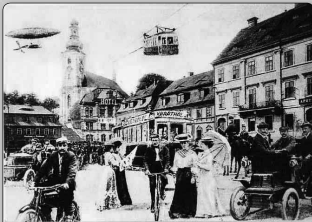
Představy o budoucnosti Krásné Lípy byly v době jejího rozkvětu smělé. Neměla chybět tramvaj do Kyjovského údolí, lanovka na Vlčí horu ani letecká doprava.