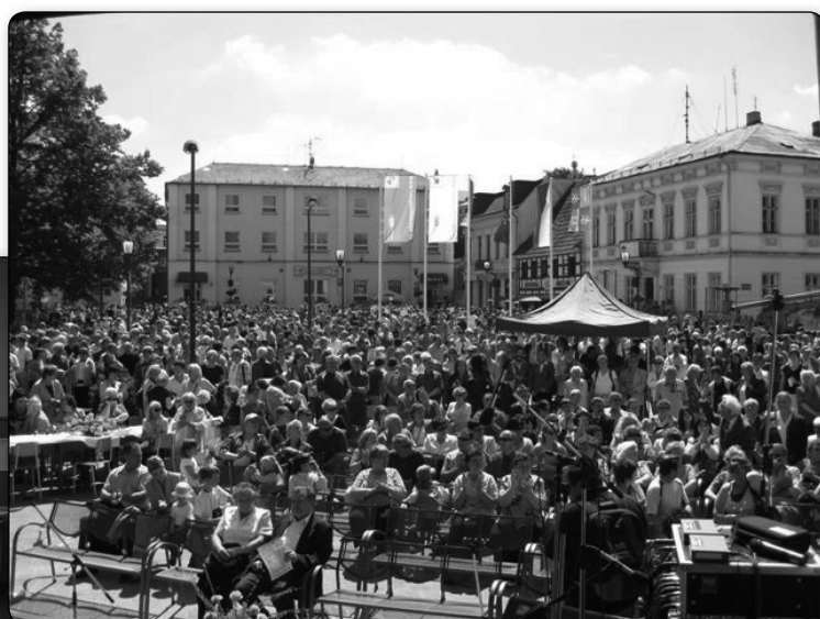
Rekord padl a hned dvakrát, do Krásné Lípy přijelo na dva a půl tisíce lidí.