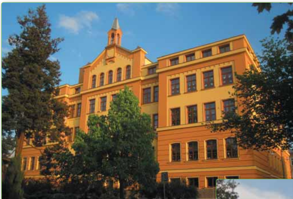
☞ Základní škola