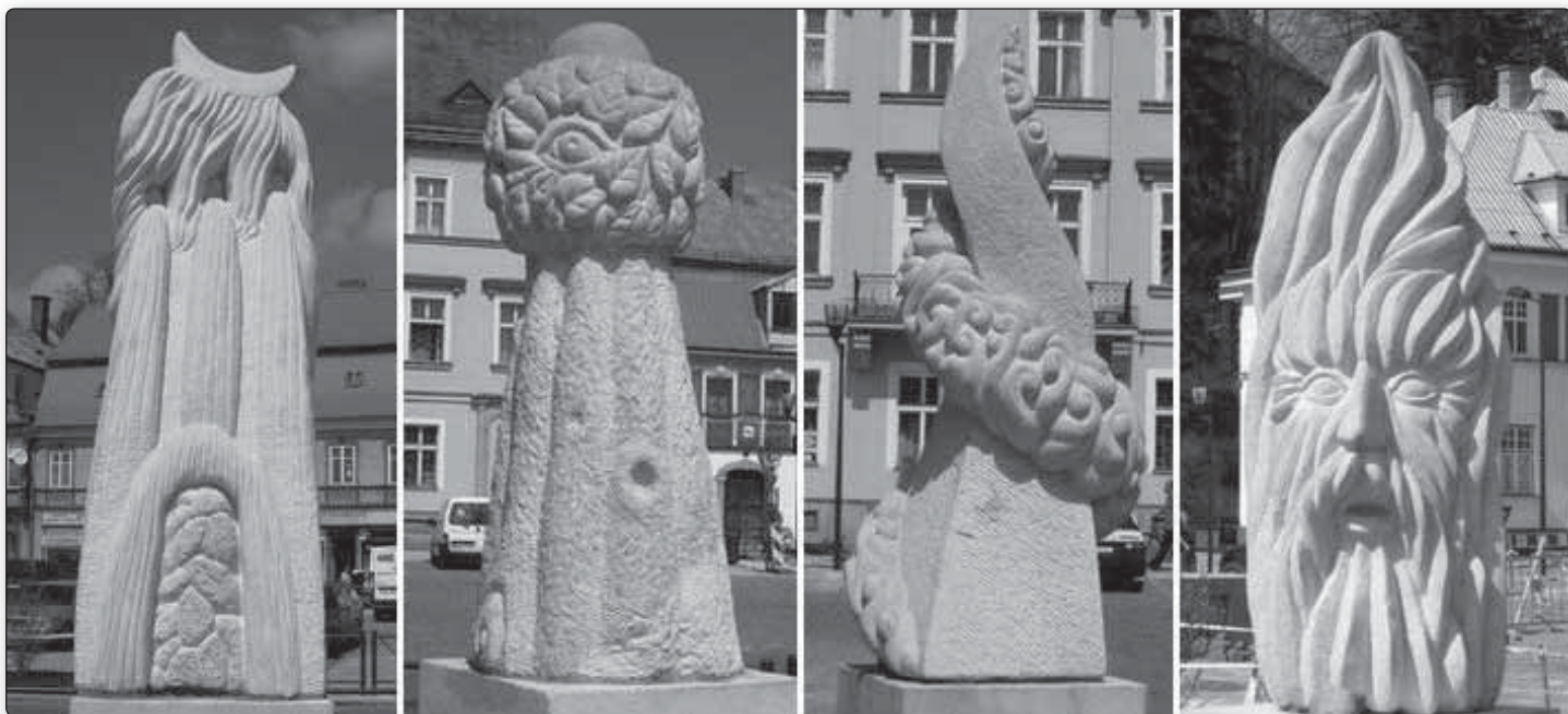
voda - země - vzduch - oheň

Kizsa z Kadaně. V podstavci jedné ze soch je uložen i vzkaz příštím obyvatelům a generacím žijícím v Krásné Lípě spolu s dalšími několika dobovými dokumenty a předměty, které souvisí s dnešní Krásnou Lípou. Celý vzkaz si můžete přečíst na webových stránkách města www.krasnalipa.cz