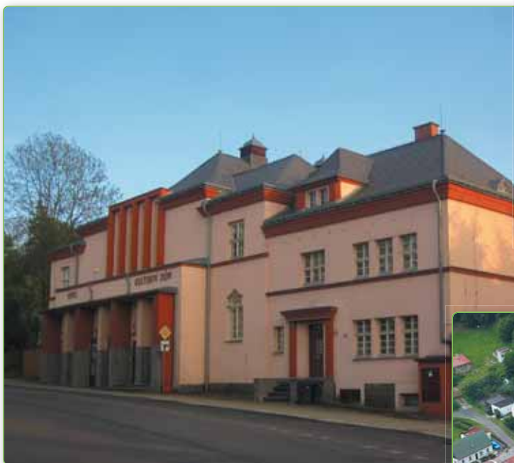
☞ Kino - kulturní dům