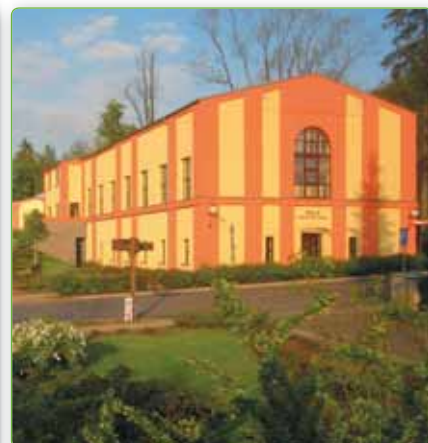
☞ Sportovní areál Českého Švýcarska