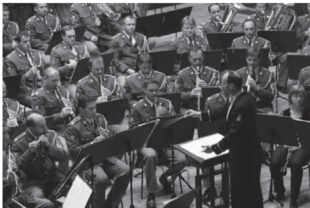
Důležitým prvkem programu bude i koncert Ústřední hudby Armády ČR přímo na náměstí.

Příští číslo Vikýře vyjde ve čtvrtek 13. května 2010