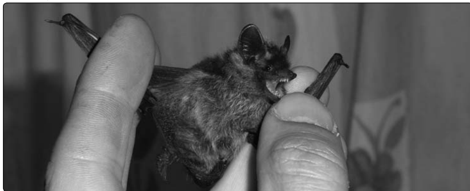
Vzácný netopýr severní. Nyní je nutné také dohledat letní kolonii, ze které pochází.