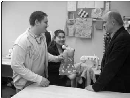
Děti z AMARI klubu předali ministru Kocábovi vlastnoručně ušitého medvěda.

Ministr pro lidská práva a menšiny Michael Kocáb zavítal do Krásné Lípy. Jeho první kroky vedly do Komunitního centra, kde se sešel s vedením města a zástupci organizací, které zajišťují programy podporující zaměstnanost, vzdělanost a integraci znevýhodněných lidí. Vedle toho se ministr Kocáb sešel i se skupinou krásnolipských Romů, se kterými se prošel Pražskou ulicí. Důvodem návštěvy Michaela Kocába byla snaha přesvědčit se, jaká je situace v regionu Šluknovsko, který byl zařazen mezi dvanáct lokalit s nejpálčivější romskou problematikou. (vik)