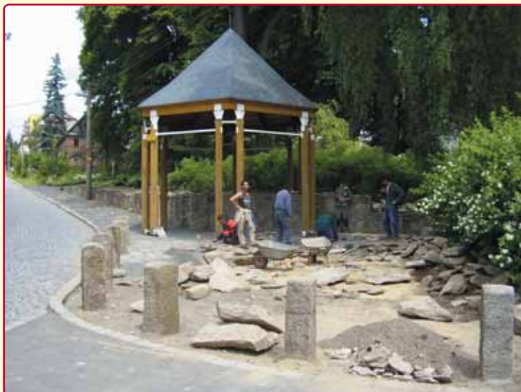
Technické služby dělají řadu činností, vytvářejí nová místa zeleně a chodníky za pomoci pracovníků VPP.

Další sakrální památka se v letošním roce dočkala drobné opravy. Svůj lesk opět získal Fritscheho kříž na Rumburské ulici.