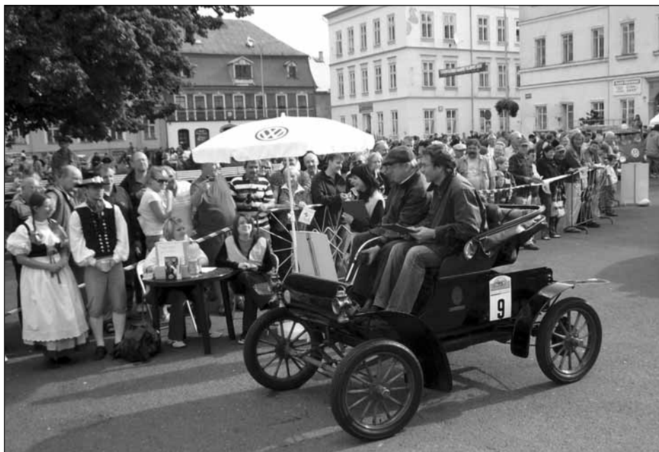
Oldsmobile z roku 1903 v Krásné Lípě, v Americe nazývaný „kočár bez koně“. Koňských sil má šest.