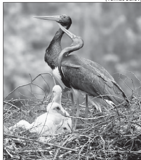
K silně ohroženým druhům, které na území NP ČS hnízdí, patří také čápa černá.