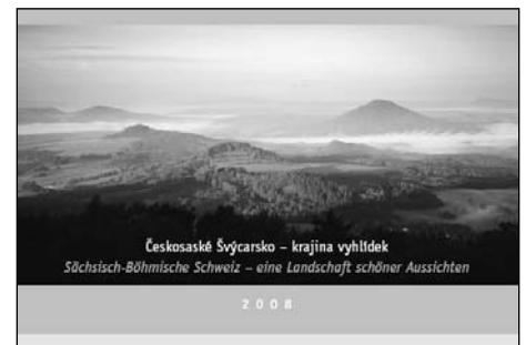
Českosaské Švýcarsko – krajina vyhlídek Sächsisch-Böhmische Schweiz – eine Landschaft schöner Ausichten 2008

Kalendář i publikace pro vás připravil a vydal tým obecně prospěšné společnosti České Švýcarsko, který vám přeje krásné prožití vánočních svátků.