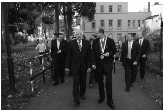
Do kulturního domu se šlo po nové cyklostezce okolo Cimráku