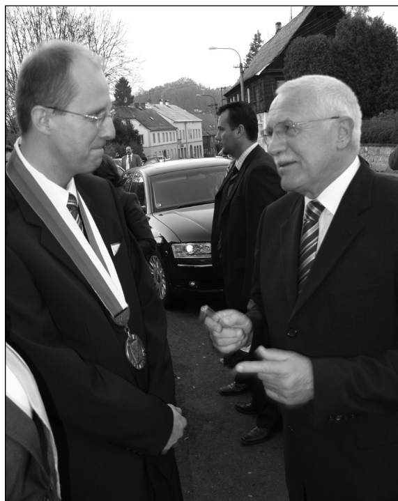
Prezident republiky odjíždí od kulturního domu s pozváním starosty města na Hrad