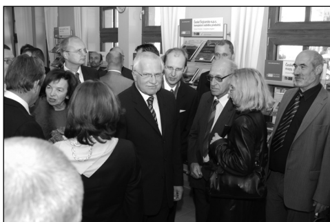
Uvnitř infocentra byl čas na pozdravy a diskuzi se zvanými hosty a prohlédnout si film o Českém Švýcarsku