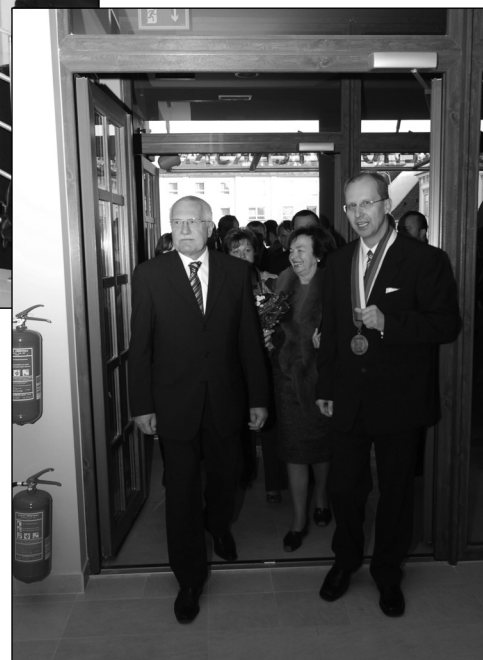
Prezident s doprovodem si prohlédl část informačního střediska a Expozice ČS