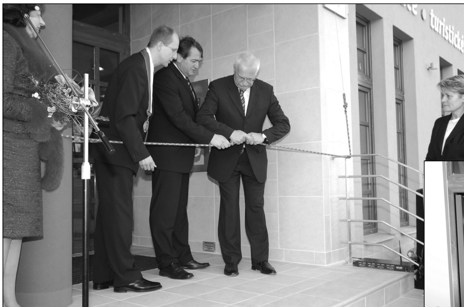
Slavnostní otevření Domu ČS učinil prezident za pomoci hejtmána Ústeckého kraje odjištěním horolezeckého lana a karabiny a odkrytím označení nad vchodem