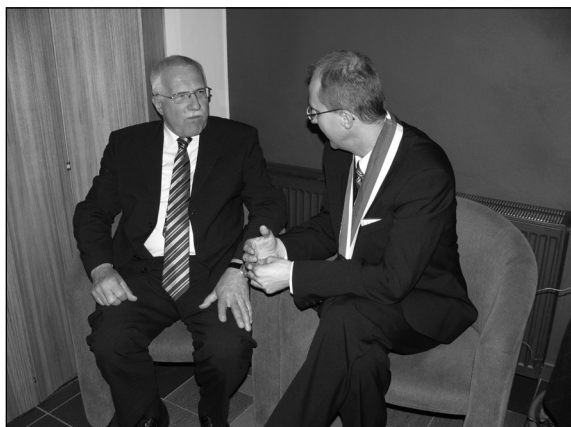
Osobní setkání a rozhovor se točil také kolem životního prostředí a evropských fondů