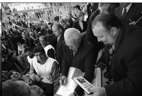
Na schodech podepisoval pan prezident své fotografie, kroniky a knihy Modrá nikoli zelená planeta