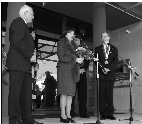
Na schodech Domu ČS pronesl prezident i první dáma projev a odpovídali na otázky dětí i dospělých