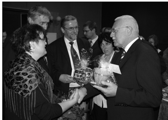
Návštěva ze sousedního Německa z Neukirchu, stejně podnikatel mluvící rusky a přechod na angličtinu nedělal prezidentovi problém