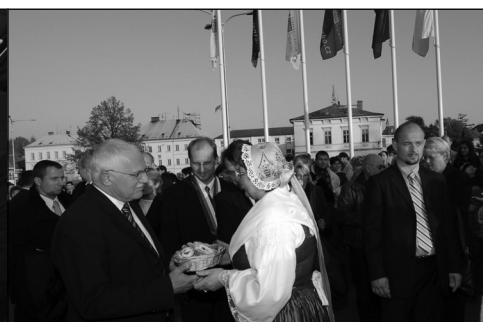
Lužičan a Křiničánek předvedli své umění v tanci a pečení koláčků