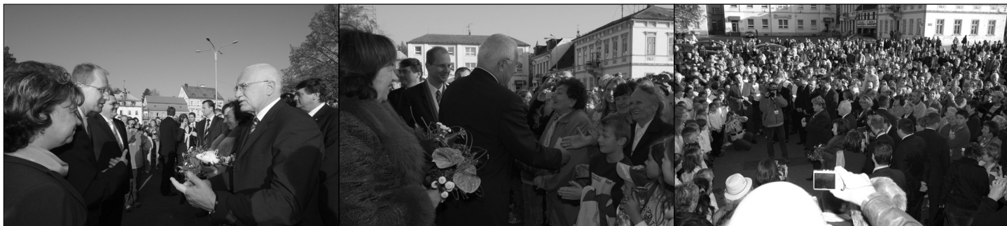
Prezident a první dáma přijeli na čas, v 16 hodin za zvuků zvonů je vítá starosta na náměstí