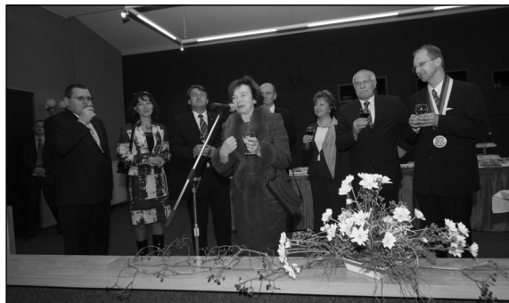
V kulturním domě se přivítal prezident i první dáma se zvanými hosty z města, Českosaského Švýcarska a Šluknovska