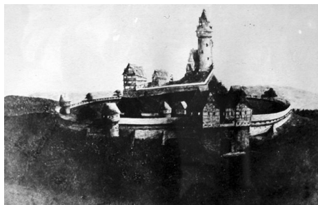
Hrad Krásný Buk v představách romantického malíře.