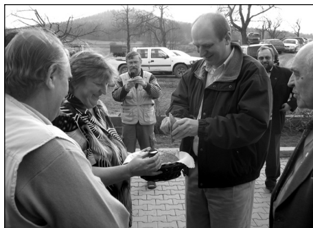
Ministr Petr Gandalovič na farmě v Panském pod Vlčí horou diskutuje problémy zemědělců v příhraničí.

Ministr zemědělství, poslanec za Ústecký kraj a člen správní rady naší o.p.s. České Švýcarsko se ještě v jarních měsících u nás na severu ukáže. (vik)