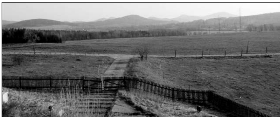
Pohled na prostor u městské vodárny, kde by stály 3 „větrníky.“