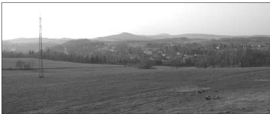
Vpravo od vrcholu Vlčí hory by se točil 1 stopadesátimetrový „větrník.“