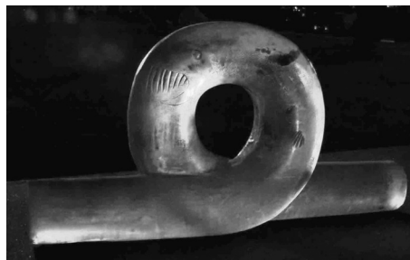
Miloš Kubišta, Optický kabel