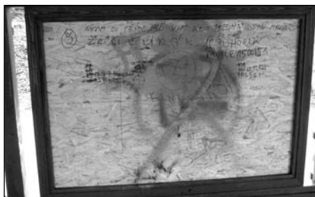
Altán u Cimráku, chybí jen podpis. Idiot.