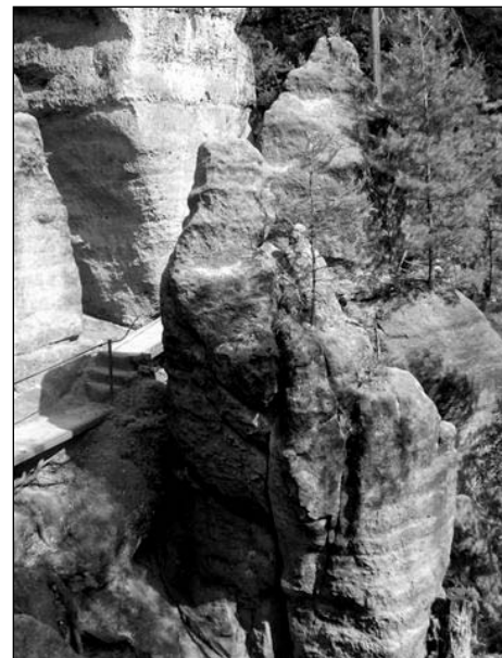
Skalní hrad v Kyjově kdysi střežil významnou obchodní stezku.