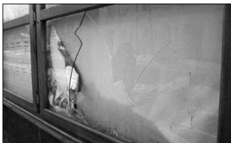
Nová vývěska po dvou týdnech...