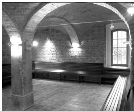
Kyjovské údolí nabízí působivé skalní partie.

Vloni dokončená Köglerova naučná stezka Krásnolipskem, stejně tak jako dokončovaná cyklostezka, bude svěřena do správy a údržby Technickým službám města. Vzhledem ke kvalitě provedení není pro nejbližší roky nutné počítat se zásadními výdaji na jejich provoz. Nelze však v této souvislosti vyloučit vandalismus, ale proti této eventualitě je však město pojištěno.