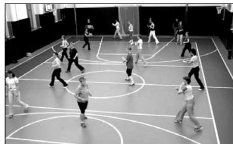
aerobic se v tělocvičně již zabydle